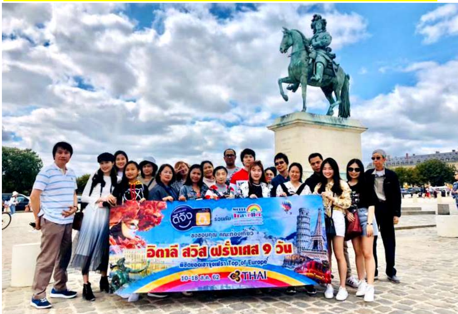
อิตาลี-สวิตเซอร์แลนด์-ฝรั่งเศส 9วัน TG PROMOTION4 วันที่ 13-21ก.ค.2562 (จำนวน26ท่าน)