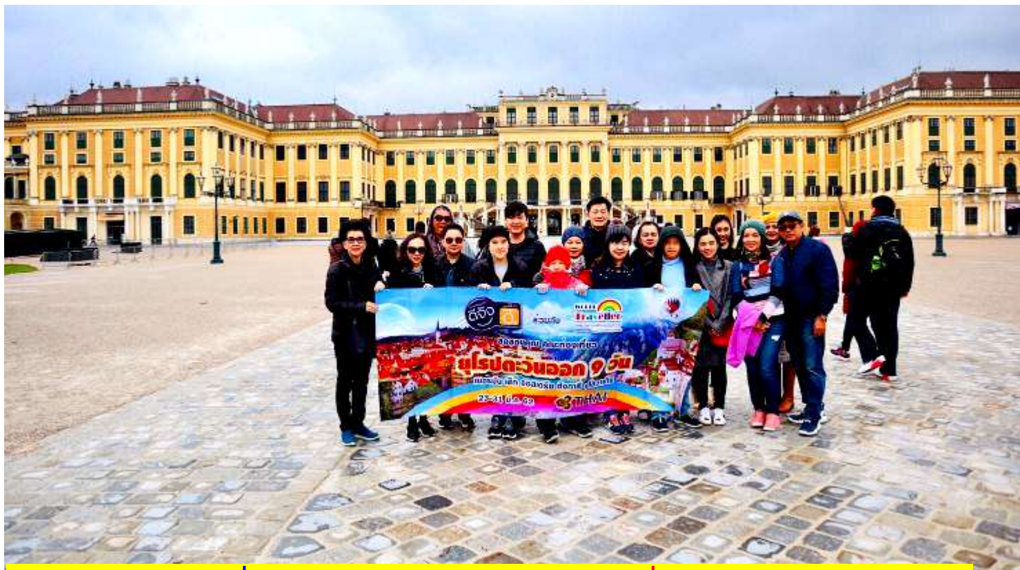
อิตาลี-สวิสเซอร์แลนด์-ฝรั่งเศส 9 วัน TG PROMOTION4 เดินทางวันที่ 2-10มี.ค.2562 (จำนวน20ท่าน)