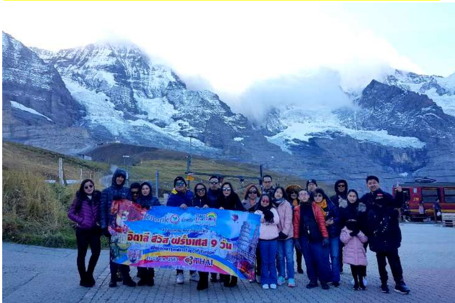
อิตาลี-สวิสเซอร์แลนด์-ฝรั่งเศส 9วัน TG PROMOTION4 เดินทางวันที่ 06-14 ต.ค.2561(จำนวน20ท่าน)