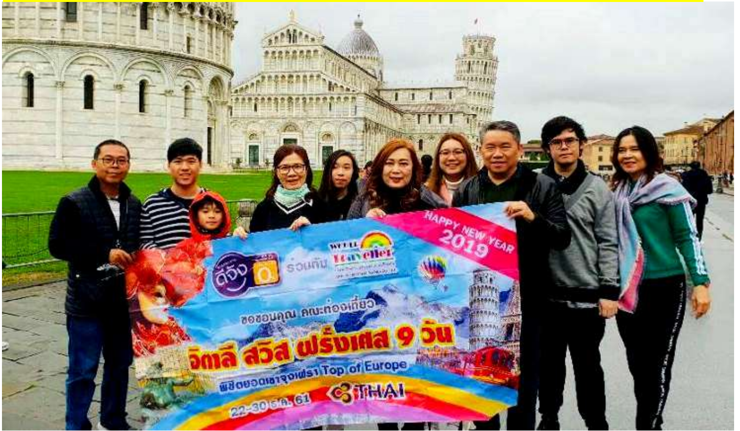
อิตาลี-สวิสเซอร์แลนด์-ฝรั่งเศส 9วัน TG PROMOTION4 เดินทาง 15-23 ธ.ค.2561(จำนวน32ท่าน)