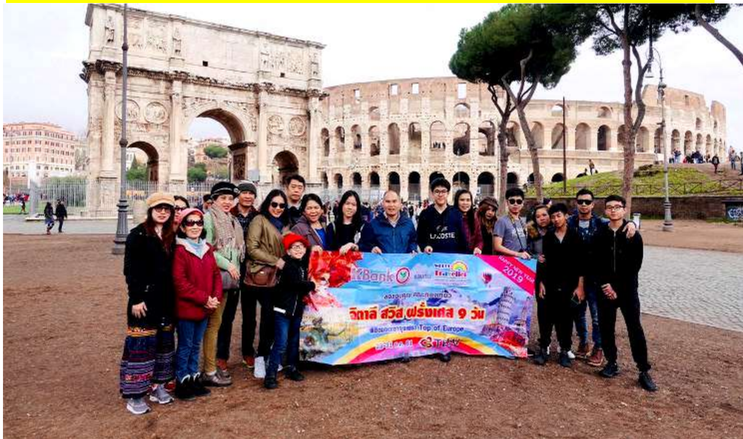
อิตาลี-สวิตเซอร์แลนด์-ฝรั่งเศส 10วัน TG DELUXE เดินทางปีใหม่ 22-31ธ.ค.2561(จำนวน20ท่าน)