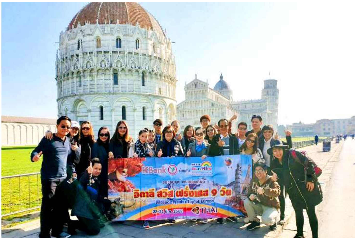
อิตาลี-สวิตเซอร์แลนด์-ฝรั่งเศส 9วัน TG PROMOTION4 วันที่23-31มี.ค.2562 (จำนวน24ท่าน) BUS2