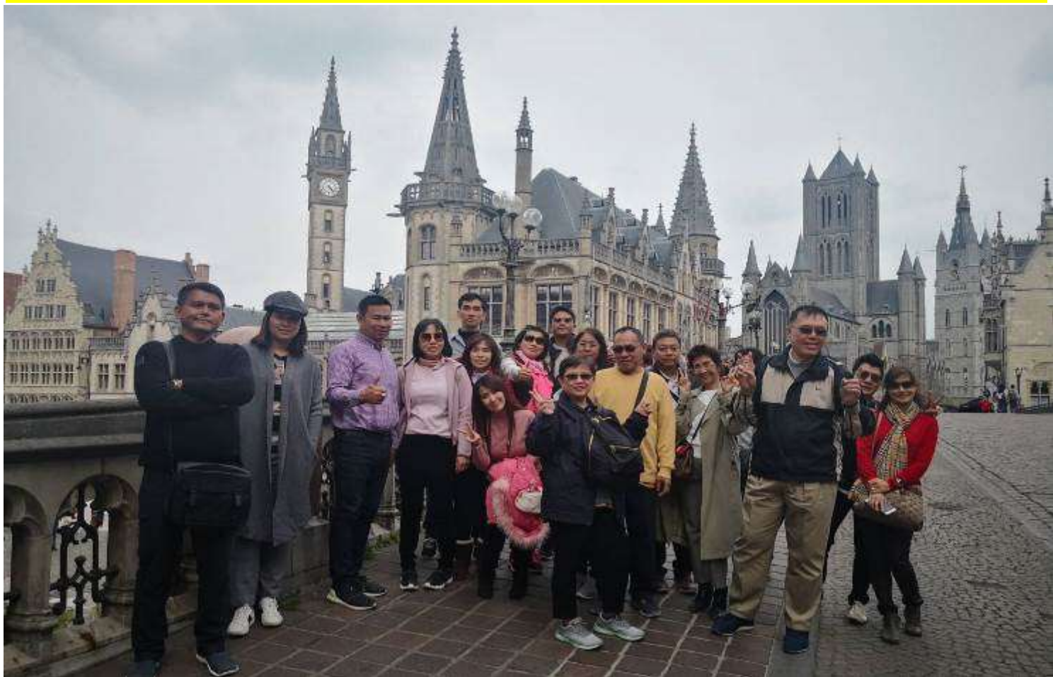
ยุโรปคอนฮอฟ(งานดอกไม้โลก)เยอรมัน เนเธอร์แลนด์ เบลเยียม สภทราบดี10-17เม.ย.2562 (จำนวน33ท่าน)