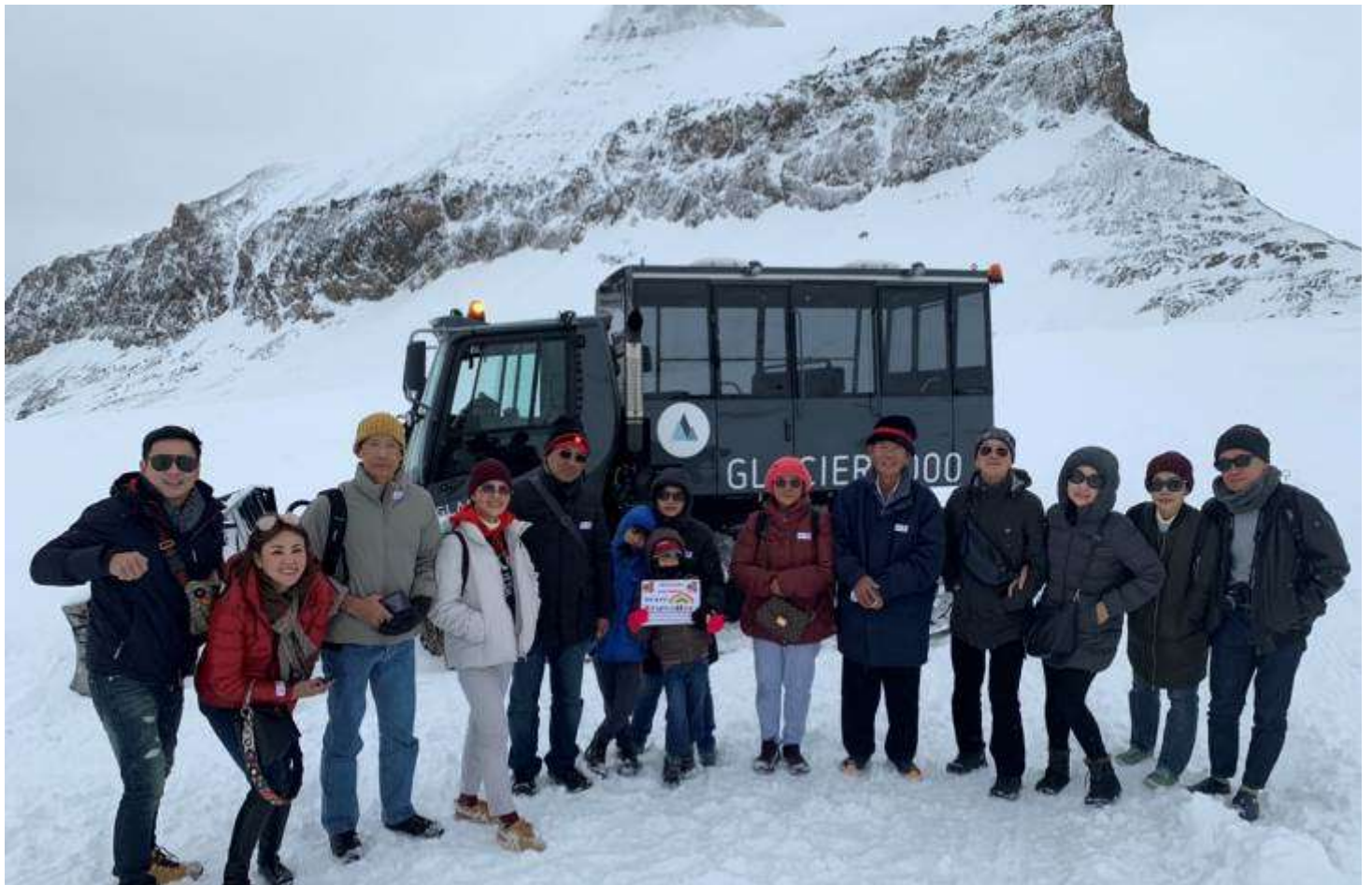
อิตาลี-สวิตเซอร์แลนด์-ฝรั่งเศส 9 วัน TG SPECIAL3 วันที่ 16-24พ.ย.2562 (จำนวน26ท่าน)