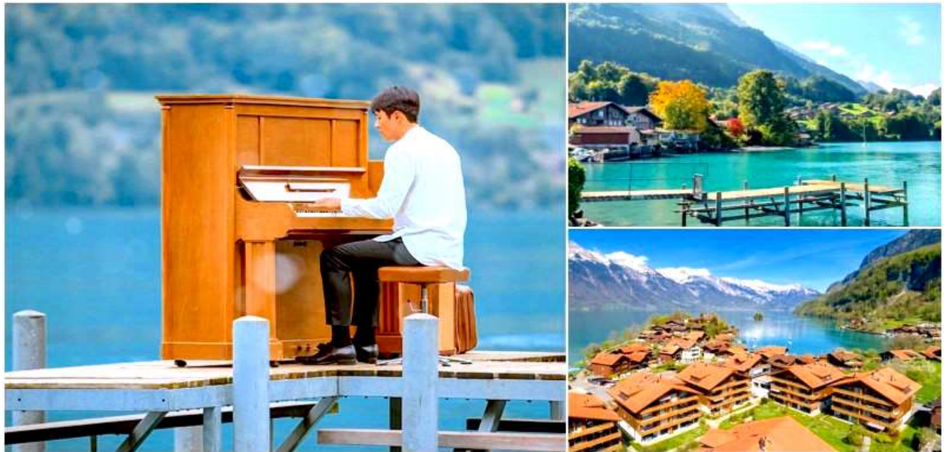
เกาหลีนั่นเอง

นำคณะออกเดินทางสู่หมู่บ้าน ISELTWALD UNSEEN ตามรอยซีรีส์ดังภาพยนตร์เกาหลี ผู้กอง Crash Landing on You มา Landing ซึ่งเมืองเล็กๆแห่งนี้ ชื่อว่า Iseltwald เป็นหนึ่งในสถานที่ถ่ายทำซีรีส์ยอดเยี่ยมจาก