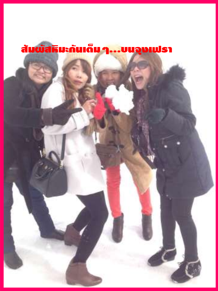
สัมผัสหิมะกันเต็ม ๆ...บน Jungfra