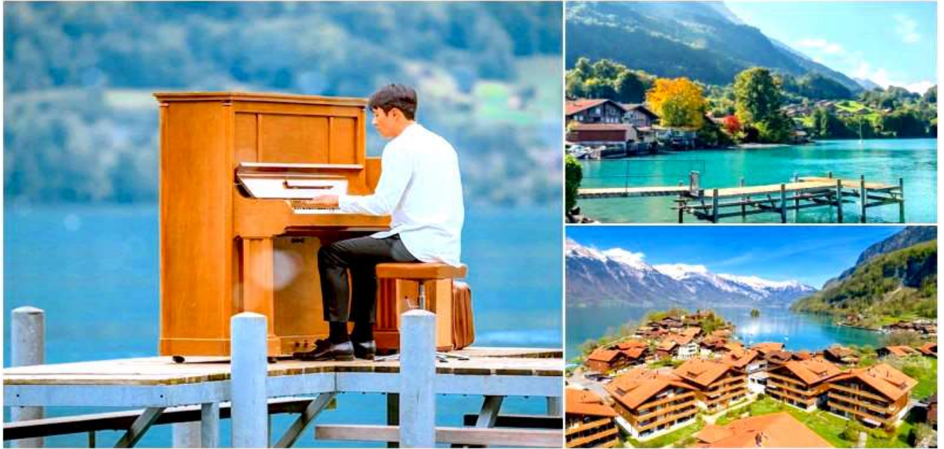
เกาหลีนั่นเอง

นำคณะออกเดินทางสู่หมู่บ้าน ISELTWALD UNSEEN ตามรอยซีรีส์ดังภาพยนตร์เกาหลี ผู้กอง Crash Landing on You มา Landing ซึ่งเมืองเล็กๆแห่งนี้ ชื่อว่า Isetwald เป็นหนึ่งในสถานที่ถ่ายทำซีรีส์ยอดนิยมจาก