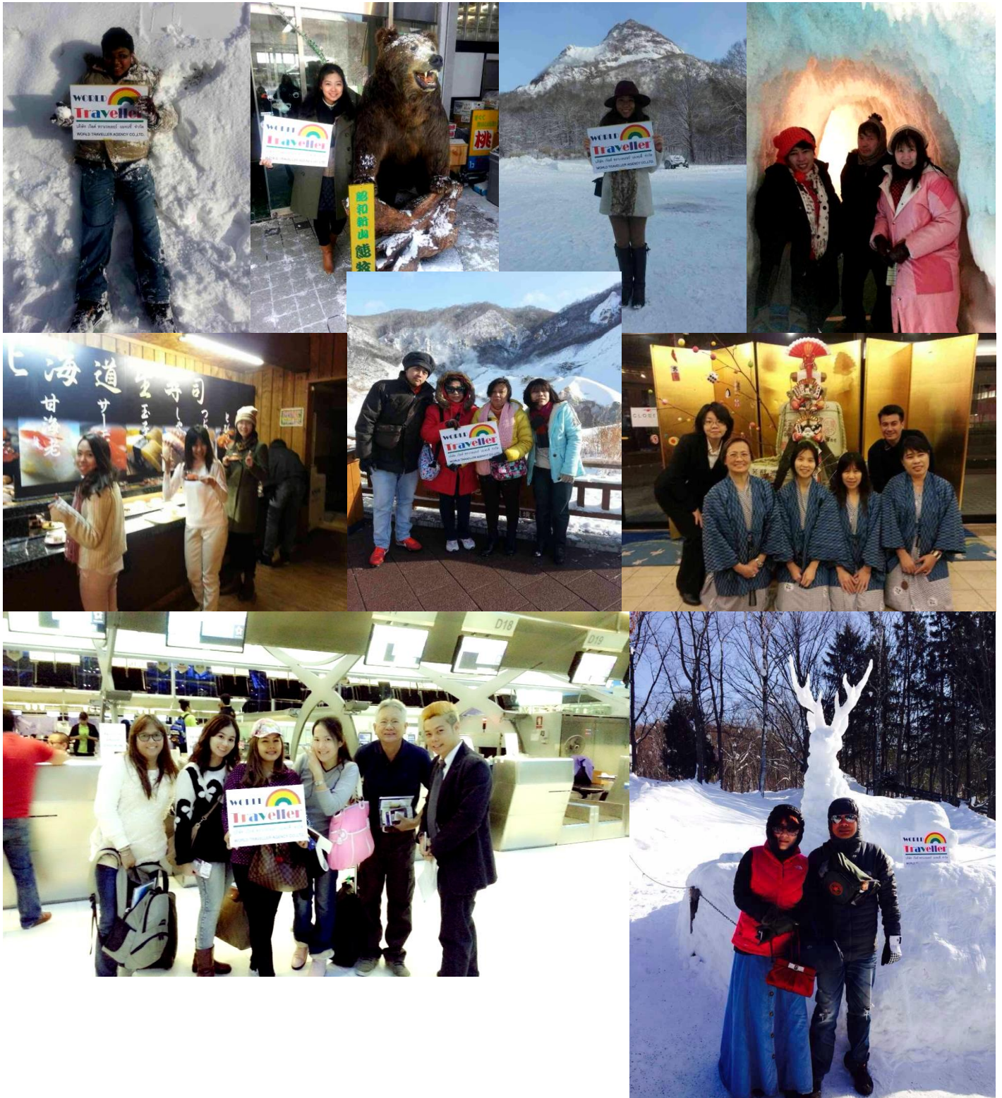
โทวี...ต้อนรับลูกค้าVIPที่สนามบิน