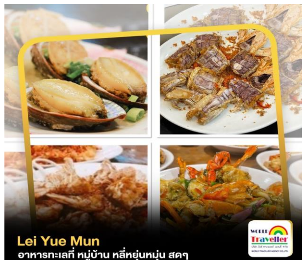
Lai Yue Mun อาหารทะเลที่ หมู่บ้าน หลีหยุนมุน สดๆ

เที่ยง ☉บริการอาหารมื้อเที่ยง Lai Yue Mun อาหารทะเลสด ๆ ณ หมู่บ้านชาวประมง หลีหยุนมุน เสริมทานด้วยเมนูหอยอบ บุฟเฟ่ต์ซังและกั้งทอด กุ้งลวกและอื่น ๆ รวมทั้งเมนูกุ้งลอบเตอร์