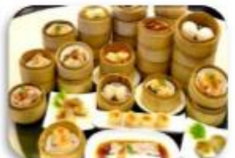
ติ่มซำฮ่องกง