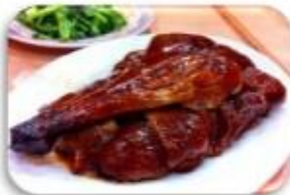
เป็ดย่าง / ห่านย่าง