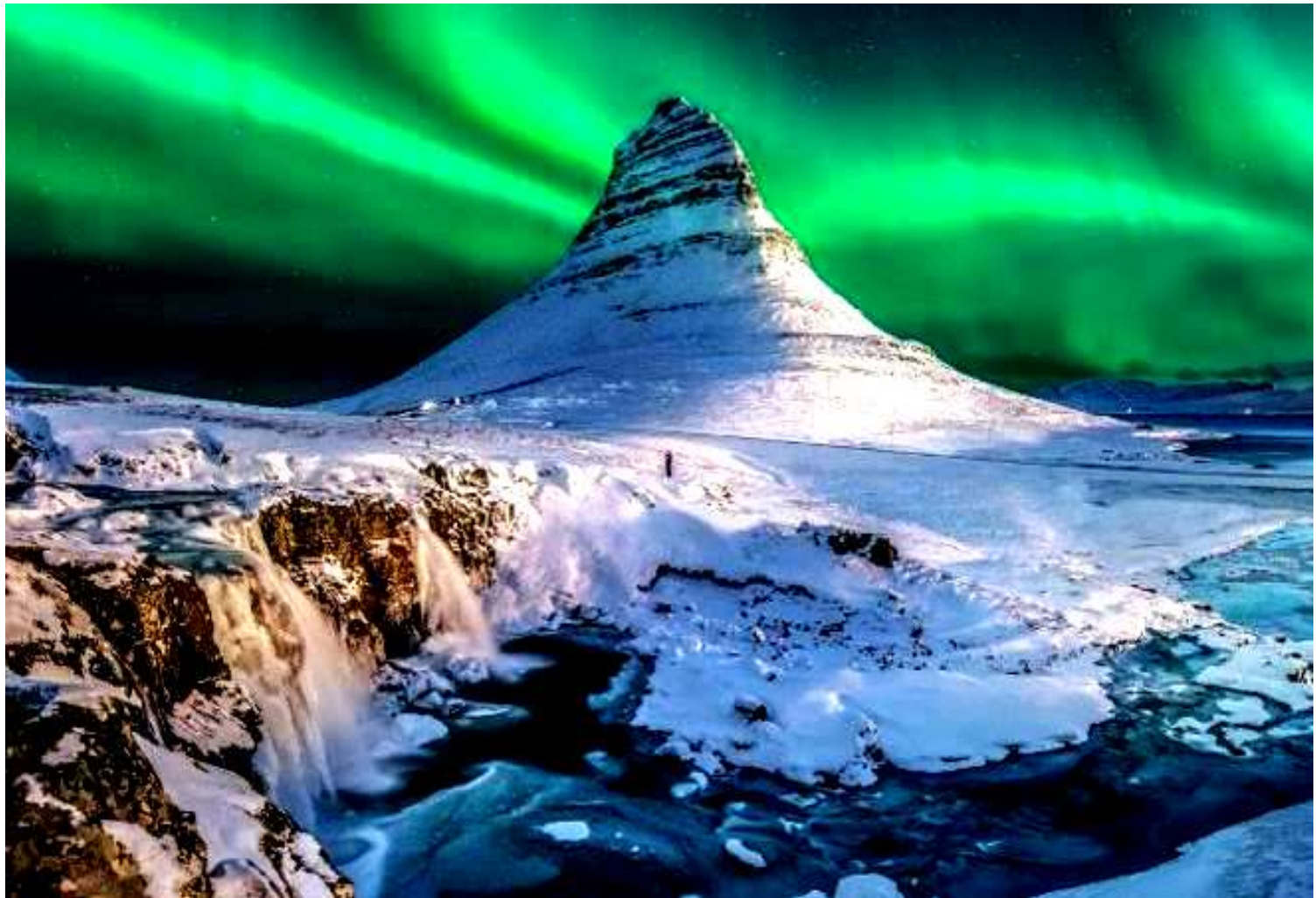
เป็นหนึ่งในสถานที่ที่ถูกถ่ายรูปมากที่สุดของไอซ์แลนด์

เดียว เป็นหนึ่งในสถานที่ที่ถูกถ่ายรูปมากที่สุดของไอซ์แลนด์ พร้อมชมน้ำตก Kirkjufellsfoss นักท่องเที่ยว ส่วนใหญ่จะถ่ายภาพสวยๆ ของน้ำตกที่มีฉากหลังเป็นภูเขา คีร์คจูเฟลล์ เป็นสถานที่ที่มีความงดงามตลอดทั้งปีไม่ว่าจะ เดินทางมาเที่ยวในช่วงใด โดยเฉพาะในฤดูหนาวที่จะมองเห็น ภูเขาหมวกแม่แมด ปกคลุมไปด้วยหิมะเป็นสีขาวโพลน