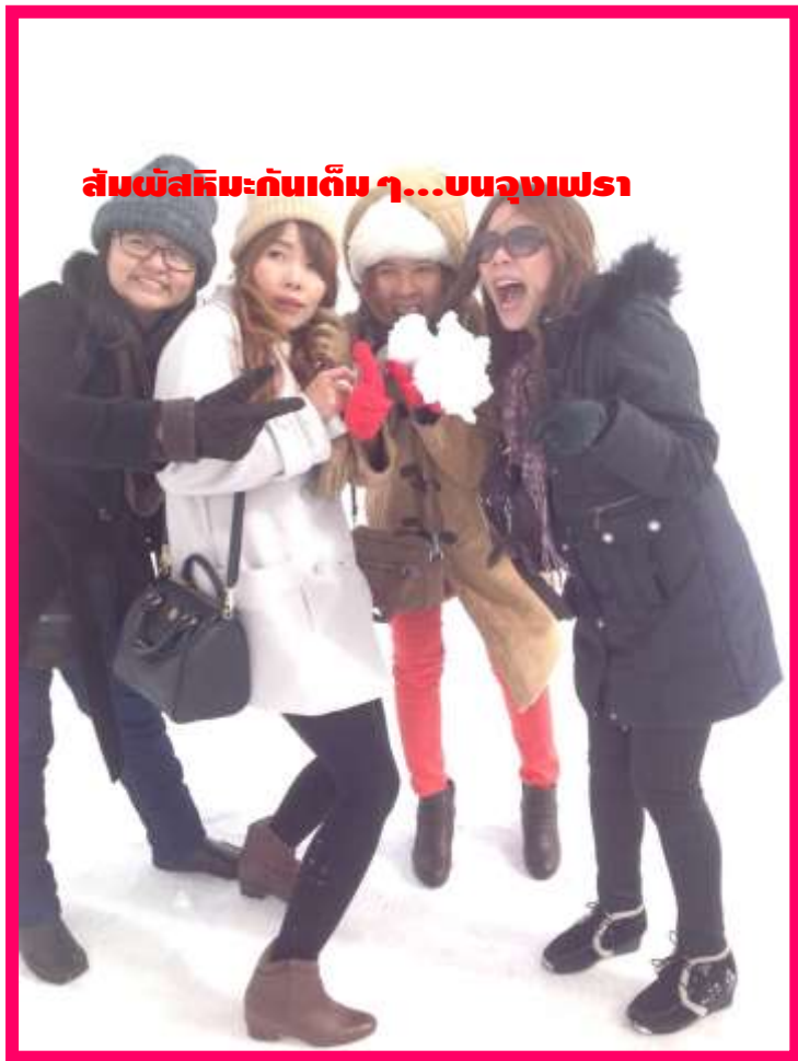
สัมผัสหิมะกันเต็ม ๆ...บนจุงเฟรา