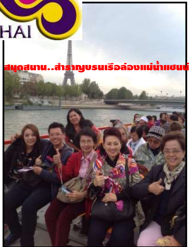
สนุกสนาน..สำราญชมเรือล่องแม่น้ำแซน

เรากำลังรอรับเกียรติจากทางท่าน...มาใช้บริการทัวร์ที่ดีจากทางเรา