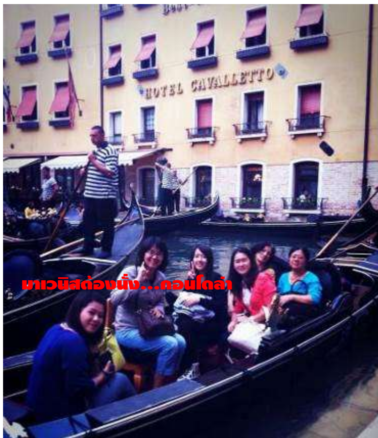
มาเวนิสต้องนั่ง...คอนโดลา