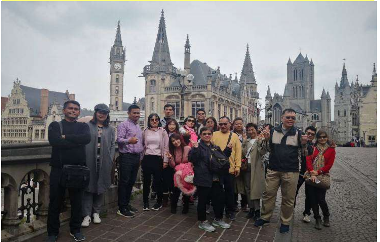
ยุโรปคอนฮอฟ(งานดอกไม้โลก)เยอรมัน เนเธอร์แลนด์ เบลเยียม สภทราบดี10-17เม.ย.2562 (จำนวน33ท่าน)