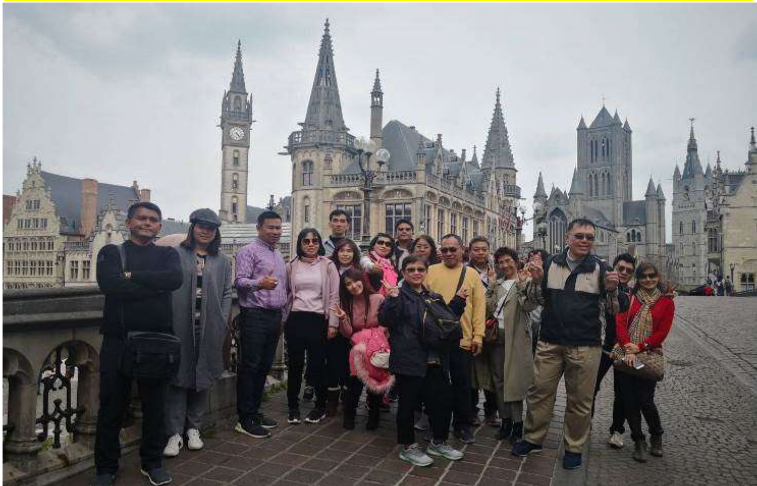
ยุโรปคอนฮอฟ(งานดอกไม้โลก)เยอรมัน เนเธอร์แลนด์ เบลเยียม สภทราด10-17เม.ย.2562 (จำนวน33ท่าน)