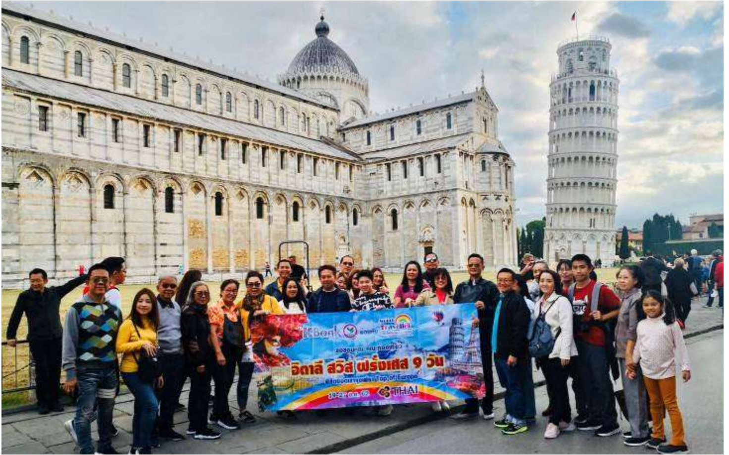
เทรนด์สวิตเซอร์แลนด์8วัน TG PROMOTION2 วันที่ 13-20 ต.ค.2562 (จำนวน42ท่าน)