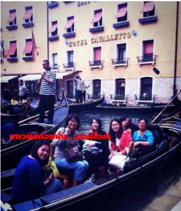
มาเวนิสต้องนั่ง...คอนโดล่า