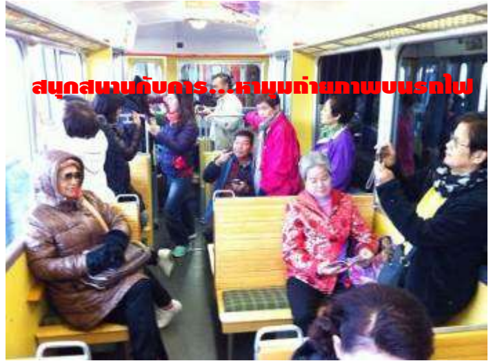
สนุกสนานกับการ...หามุมถ่ายภาพบนรถไฟ

อยากสนุกสนาน และประทับใจกันแบบนี้... มาเที่ยวกับเรา: ครีบริบรองไม่ผิดหวัง