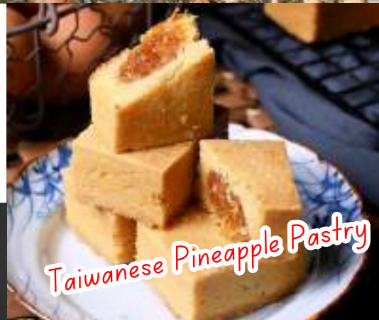
Taiwanese Pineapple Pastry

พาท่านชิมพายส์บะรด 'สับปะรด' ในภาษาจีน (鳳梨 - ฟังหลี) หมายถึง 'ความโชคดีเข้ามา มาไต้หวันทั้งที ต้องไม่พลาดชิมพายส์บะรด! แป้งกรอบอบหอมกรุ่น ไส้แน่น หอมละมุน ทุกคำ รสกลมกล่อม ไส้สับปะรดเข้มข้น หวานนิดเปรี้ยวหน้อยของฝากสุดฮิตที่ใครได้ชิมก็ยิ้มออก!"