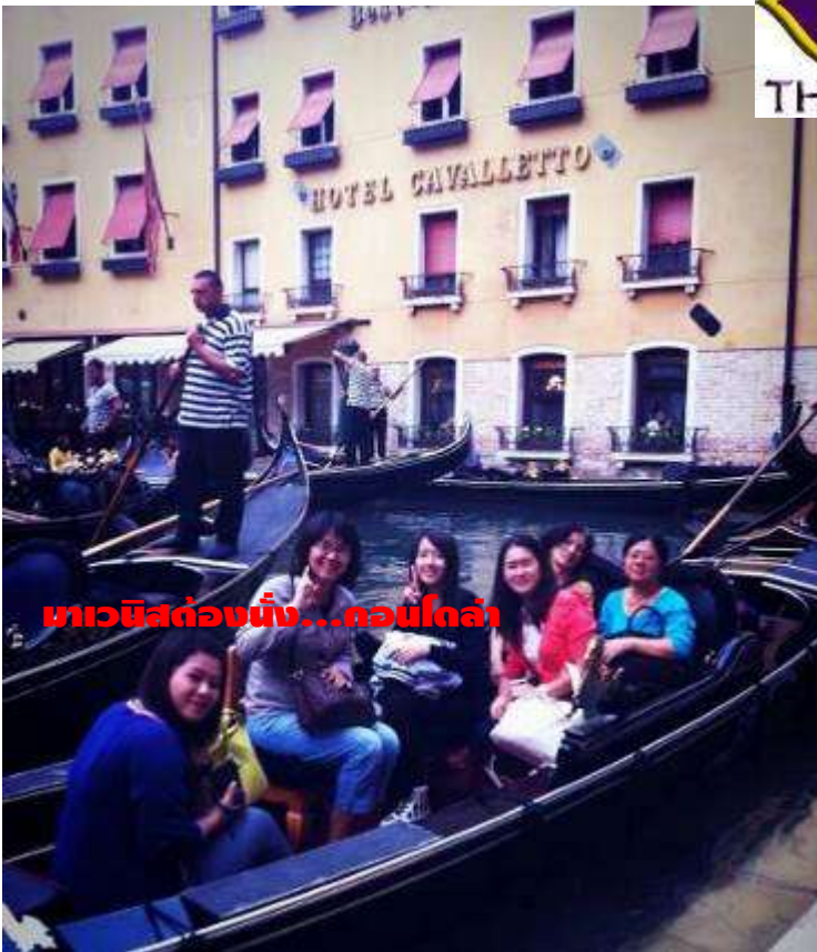
มาเวนิสต้องนั่ง...คอนโดล่า