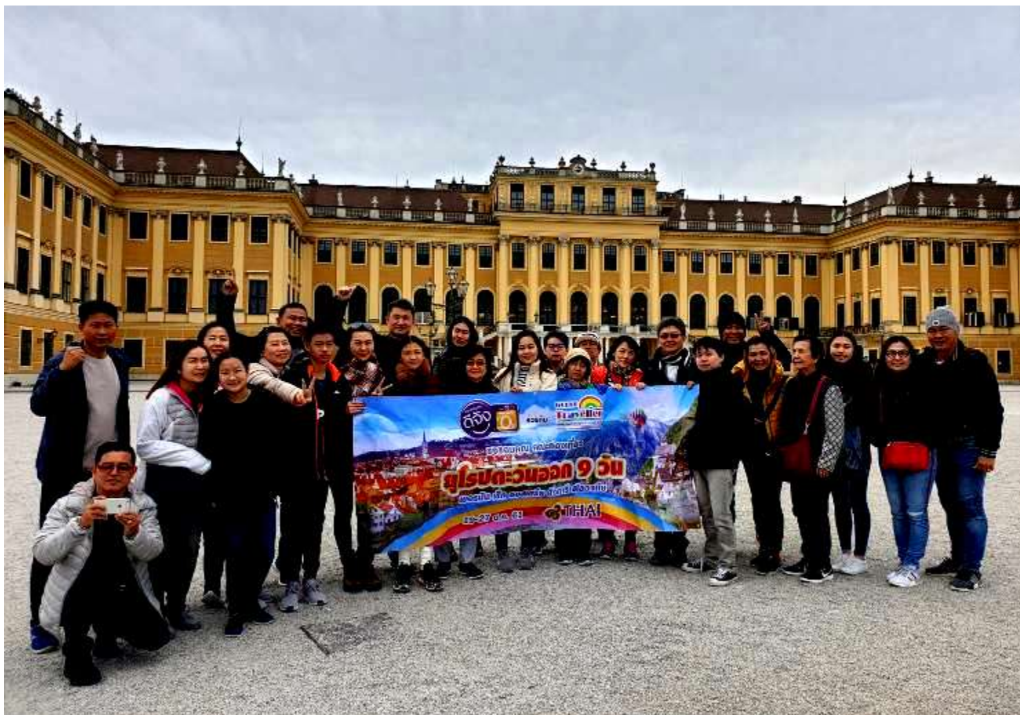
แอนด์สวิตเซอร์แลนด์10วัน TG DELUXE C แพททิ หนดี เดินทางวันที่ 14-23 ต.ค.2561 (จำนวน22ท่าน)