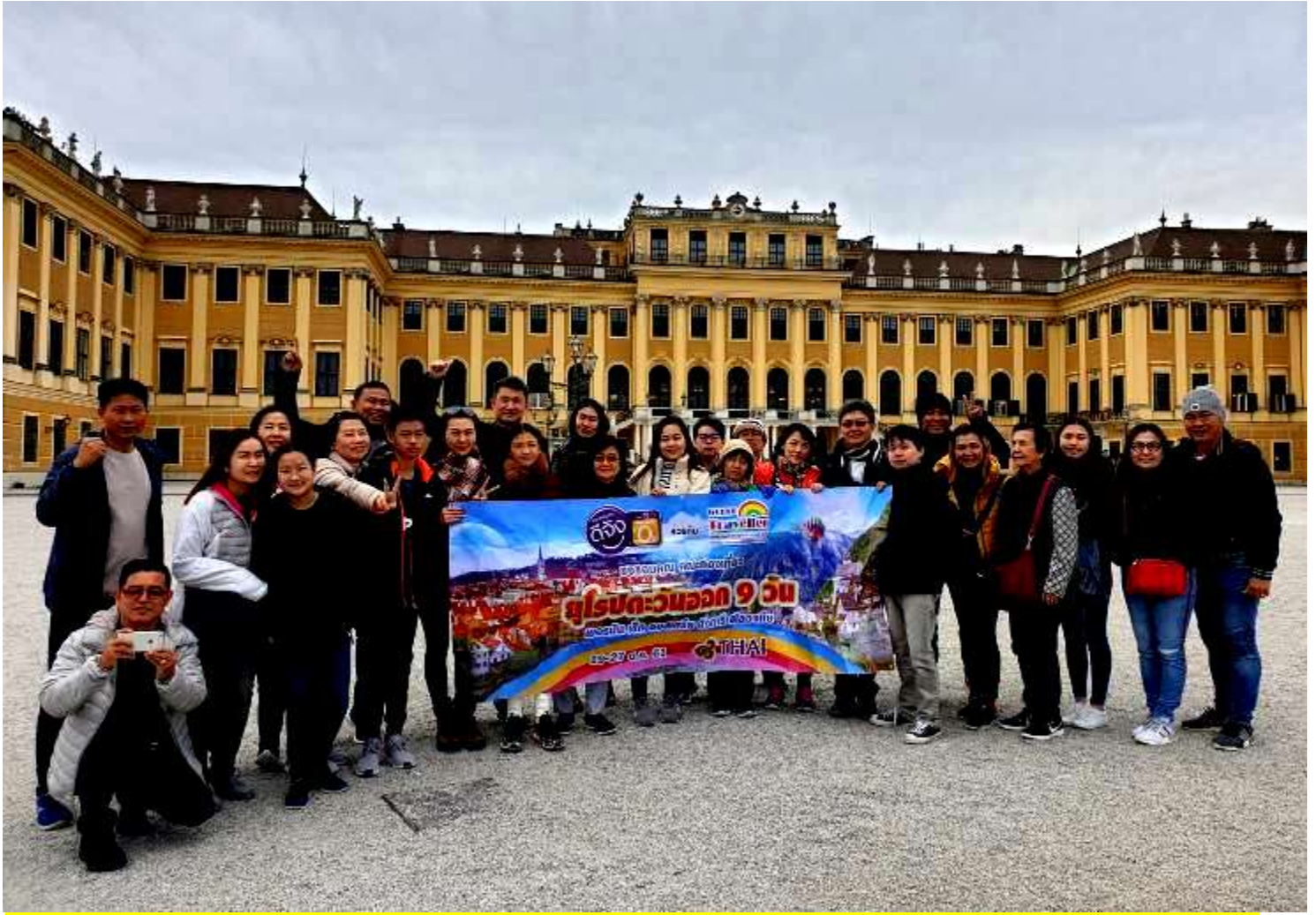
แอนด์สวิตเซอร์แลนด์10วัน TG DELUXE C แพคเกจ มนต์ เดินทางวันที่ 14-23 ต.ค.2561 (จำนวน22ท่าน)