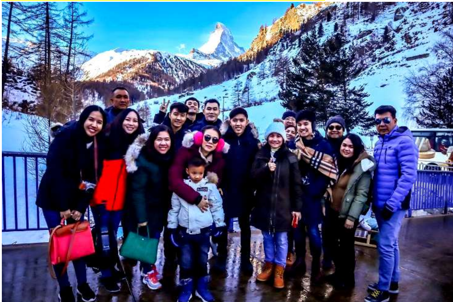
ยุโรปตะวันออก 9วัน TG DELUXE พัก Hallstatt เดินทางปีนํ 29ค.ค.-06ม.ค.2562(จํนวน28ทํน)