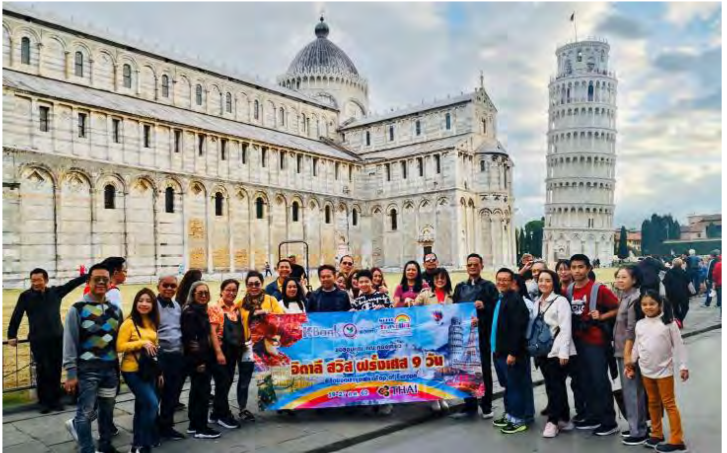
เทรนด์สวิตเซอร์แลนด์8วัน TG PROMOTION2 วันที่ 13-20 ต.ค.2562 (จำนวน42ท่าน)