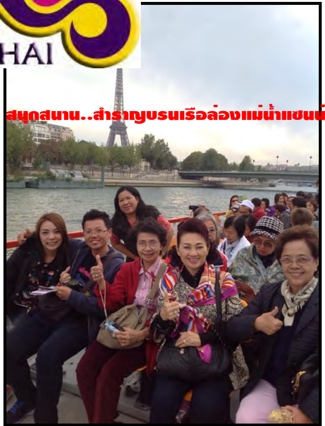
สนุกสนาน..สำราญชมเรือล่องแม่น้ำแซน

เรากำลังรอรับเกียรติจากทางท่าน...มาใช้บริการทัวร์ที่ดีจากทางเรา