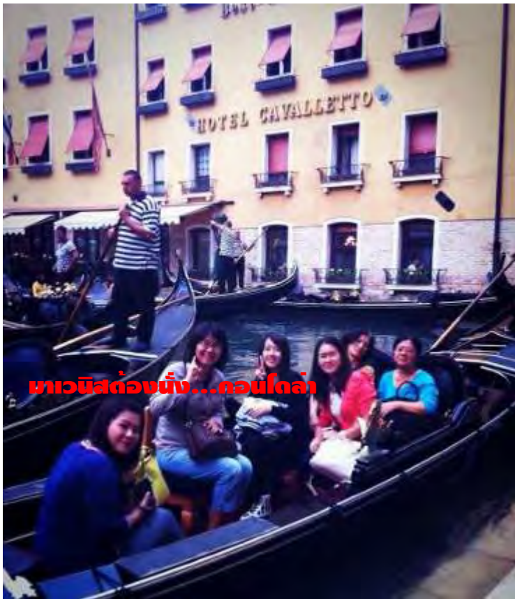
มาวณีสต่องนี้...คอนโดล่า