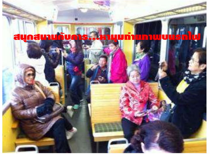
สนุกสนานกับการ...หามุมถ่ายภาพบนรถไป

อยากสนุกสนาน และประทับใจกันแบบนี้... มาเที่ยวกับเรา: ครีบริบรองไม่ผิดหวัง