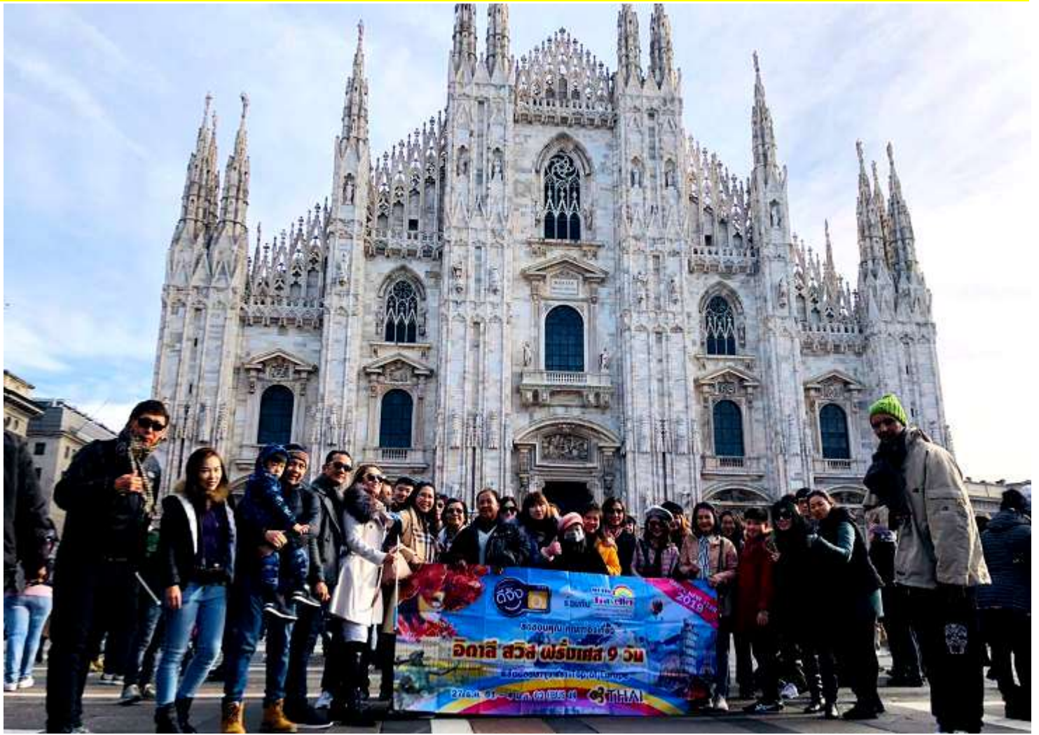
อิตาลี-สวิสเซอร์แลนด์-ฝรั่งเศส 9วัน TG PROMOTION4 เดินทางปีใหม่ 25ธ.ค.-02ม.ค.2562(จำนวน32ท่าน)