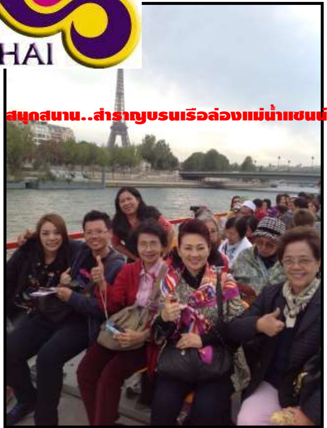
สนุกสนาน..สำราญชมเรือล่องแม่น้ำแซน

เรากำลังรอรับเกียรติจากทางท่าน...มาใช้บริการทัวร์ที่ดีจากทางเรา