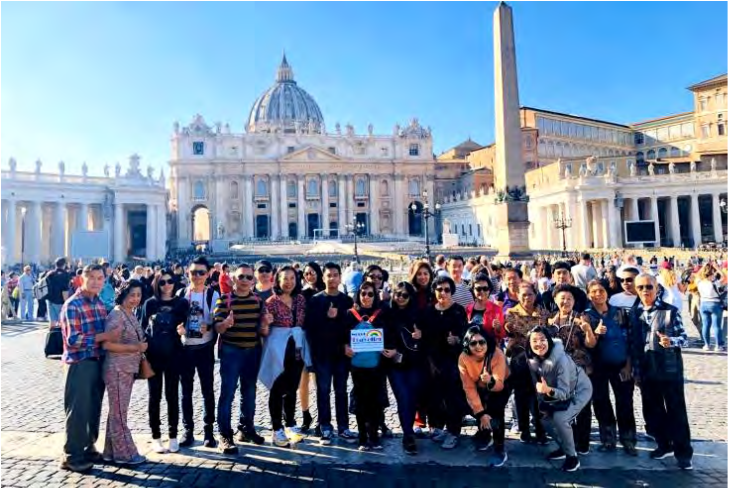
เนเธอร์แลนด์ 9วัน TG SUPERIOR วันที่ 23-31 ต.ค.2562 (จำนวน20ท่าน)