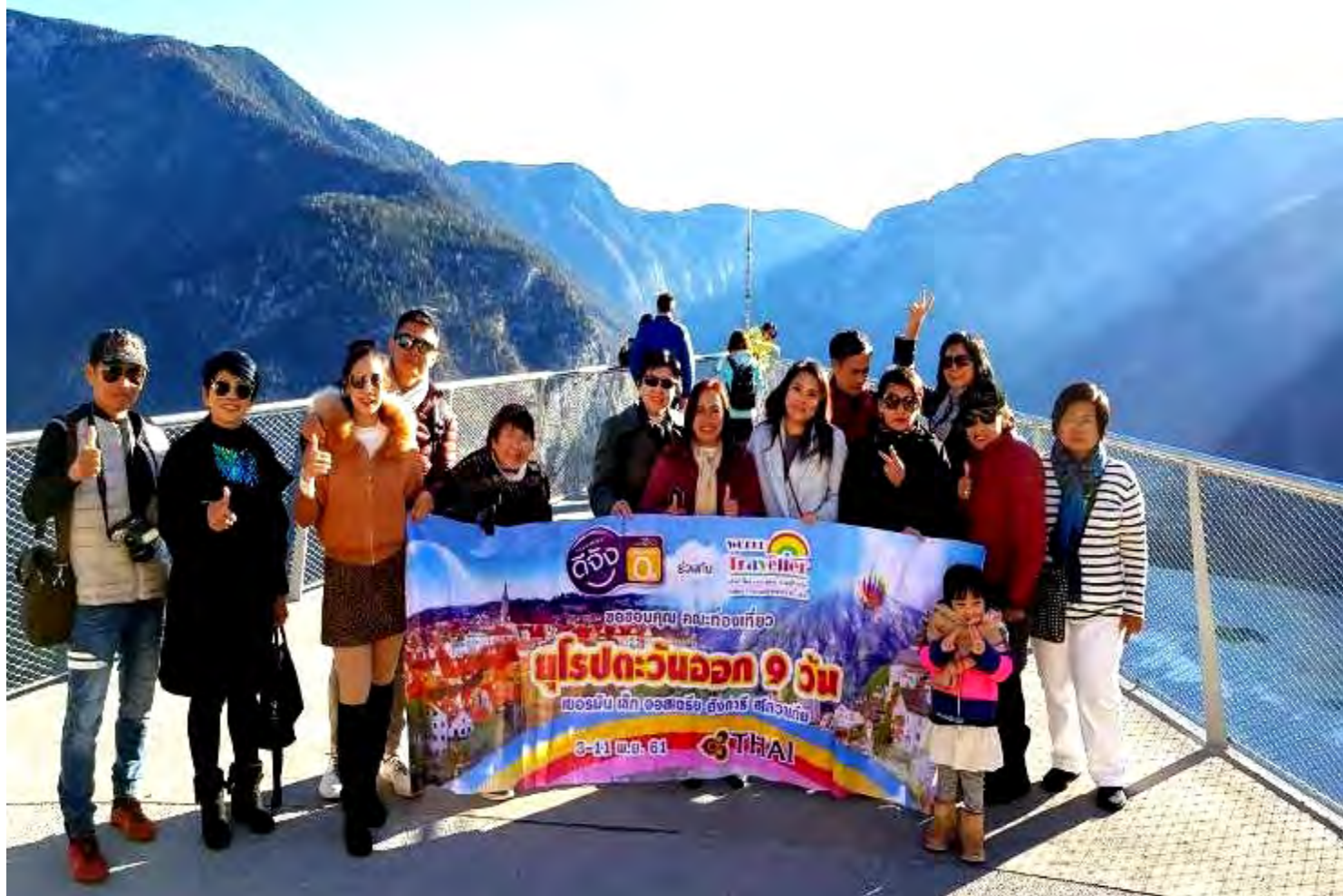
แอลป์สวิสเซอร์แลนด์ 8 วัน TG PROMOTION ช่วงหยุดปียะ-21-28ต.ค.2561(จำนวน34ท่าน)