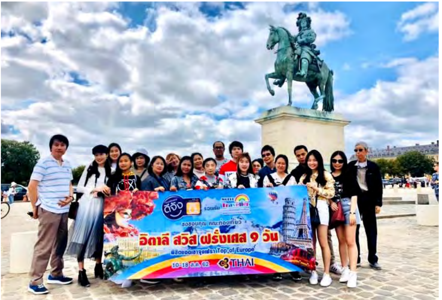
อิตาลี-สวิตเซอร์แลนด์-ฝรั่งเศส 9วัน TG PROMOTION4 วันที่ 13-21ก.ค.2562 (จำนวน26ท่าน)