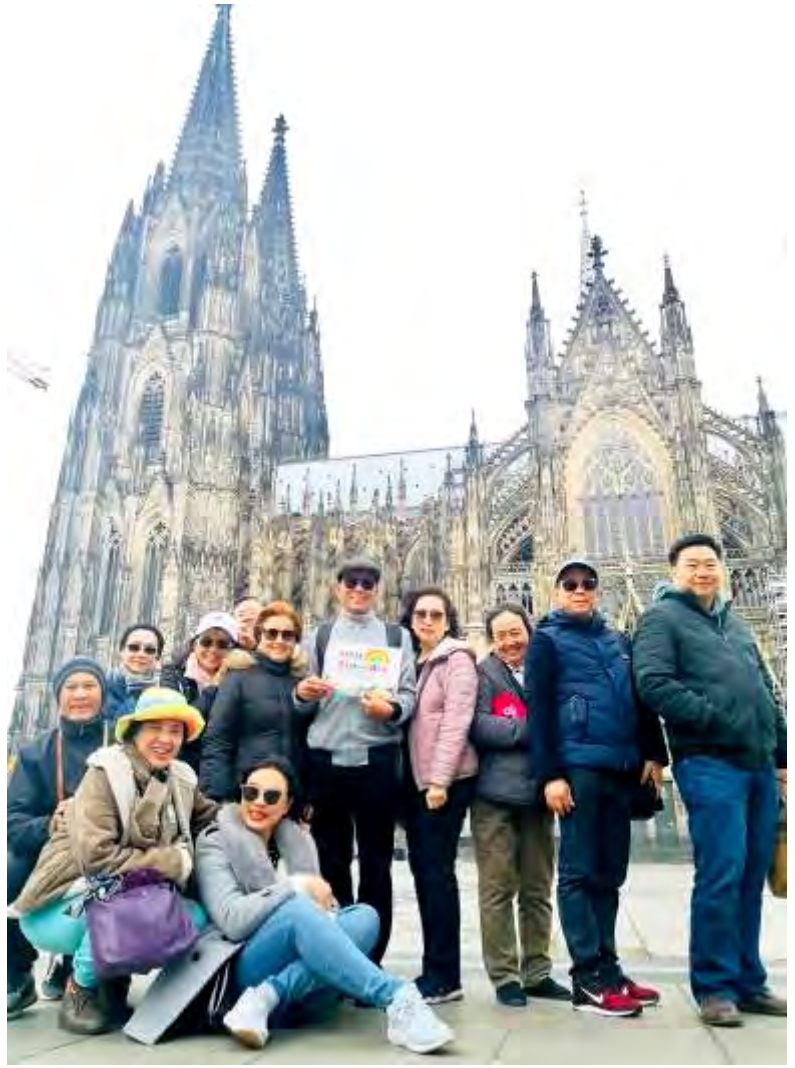
ยุโรปตะวันออก 9วัน TG SUPERIOR พัชรินทร์เกษม เดินทางวันที่ 23-31มี.ค.2562 (จำนวน17ท่าน)