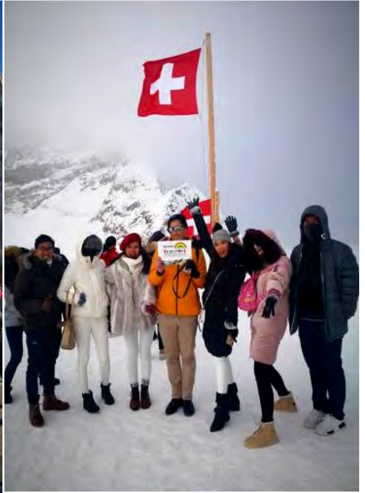
อิตาลี-สวิสเซอร์แลนด์-ฝรั่งเศส 9วัน TG PROMOTION4 เดินทางวันที่ 17-25พ.ย.2561(จำนวน15ท่าน)bus2