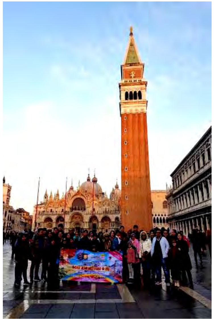
แกรนด์สวีทเซอร์แลนด์ 11วัน TG ปีใหม่ 29ธ.ค.-07ม.ค.2562(จำนวน18ท่าน)