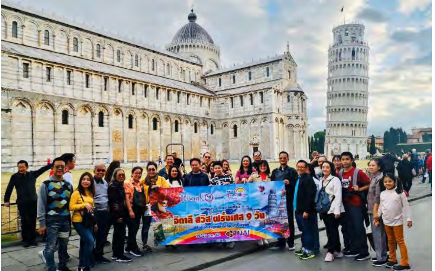
แอนด์สวิตเซอร์แลนด์8วัน TG PROMOTION2 วันที่ 13-20 ต.ค.2562 (จำนวน42ท่าน)