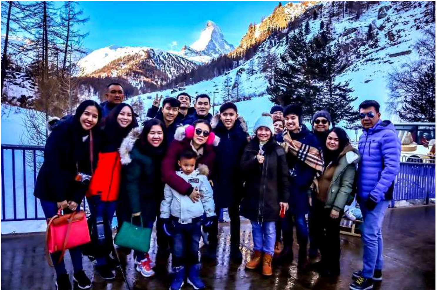
ยุโรปตะวันออก 9วัน TG DELUXE พัก Hallstatt เดินทางปีนํ 29ค.ค.-06ม.ค.2562(จํนวน28ทํน)