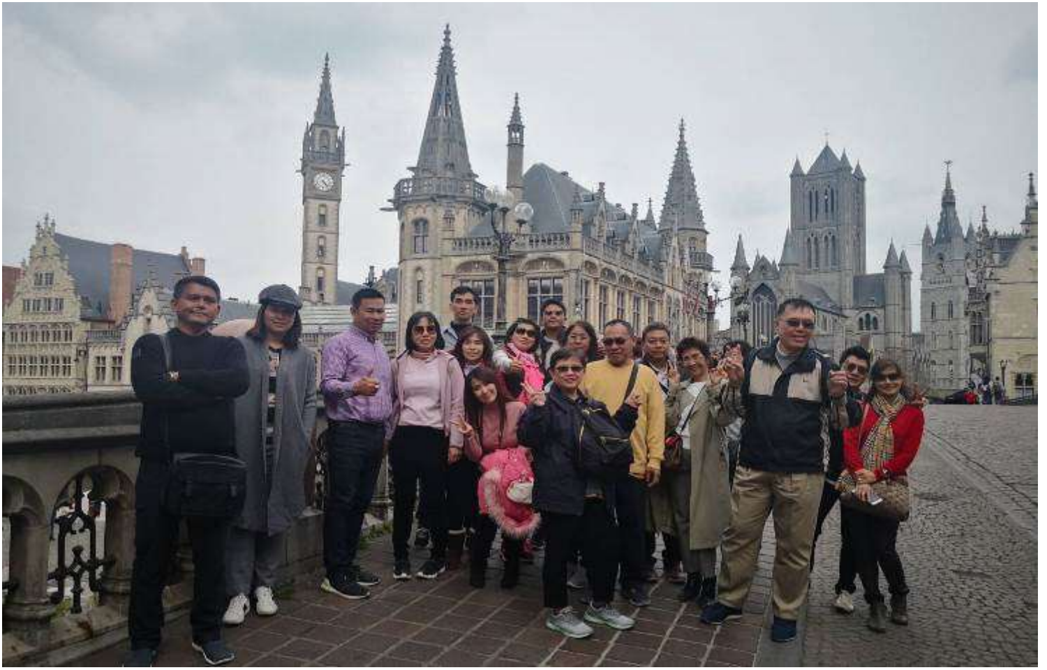
ยุโรปคอนฮอฟ(งานดอกไม้โลก)เยอรมัน เนเธอร์แลนด์ เบลเยียม สภทราบดี10-17เม.ย.2562 (จำนวน33ท่าน)