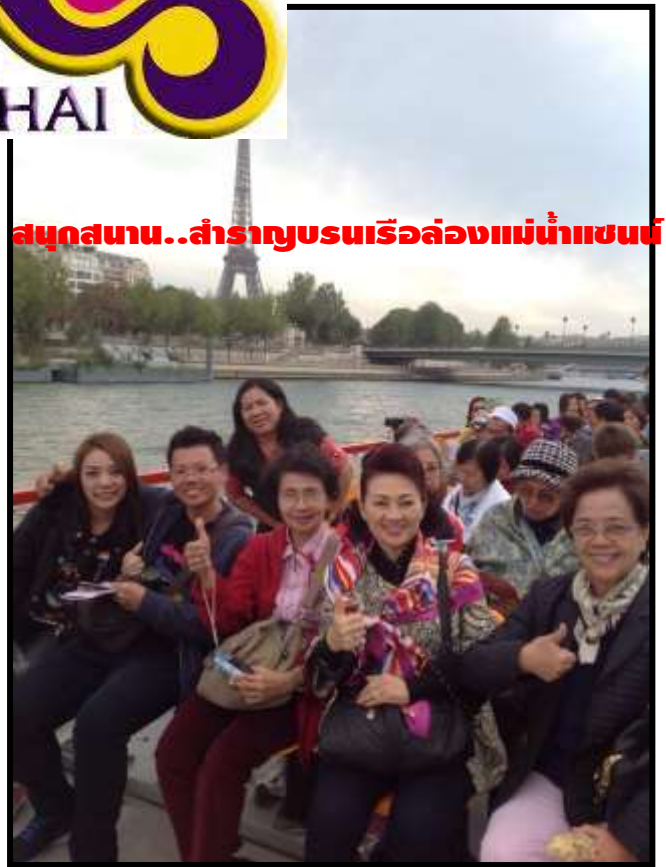
สนุกสนาน..สำราญชมเรือล่องแม่น้ำแซน

เรากำลังรอรับเกียรติจากทางท่าน...มาใช้บริการทัวร์ที่ดีจากทางเรา