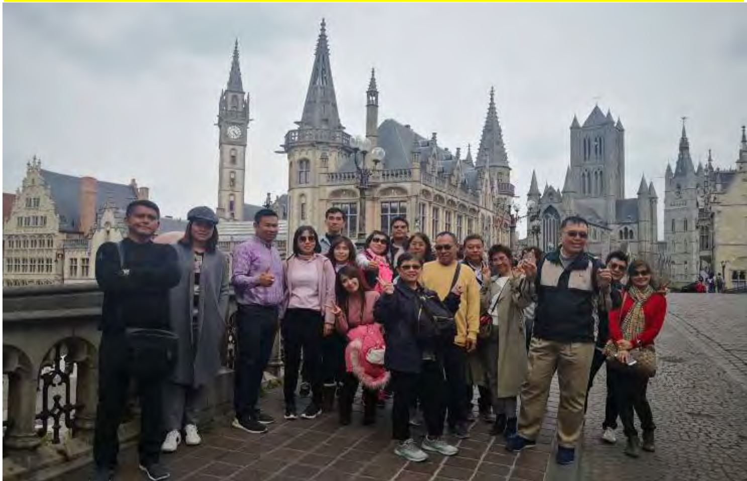
ยุโรปคอนเวนออฟ(งานดอกไม้โลก)เยอรมัน เนเธอร์แลนด์ เบลเยียม สภกรานต์10-17เม.ย.2562 (จำนวน33ท่าน)