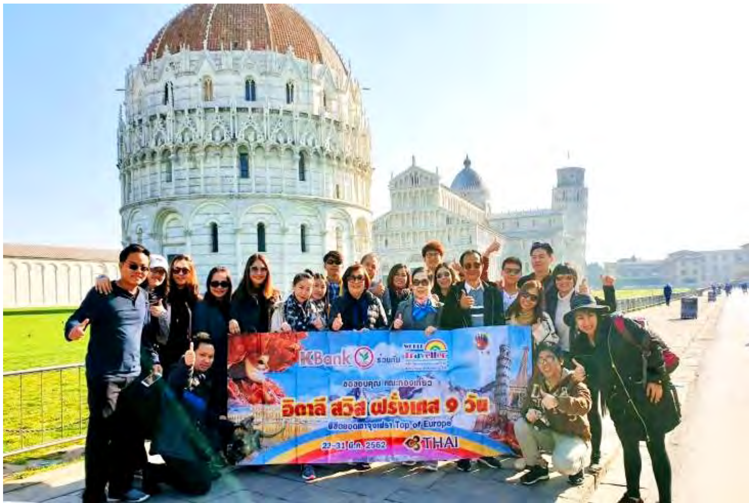
อิตาลี-สวิสเซอร์แลนด์-ฝรั่งเศส 9วัน TG PROMOTION4 วันที่23-31มี.ค.2562 (จำนวน24ท่าน) BUS2แพน