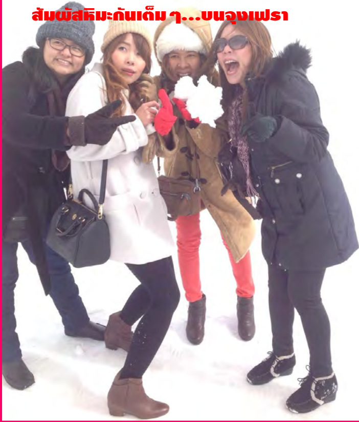
สัมผัสหิมะกันเต็ม ๆ...บนจุงเฟรา