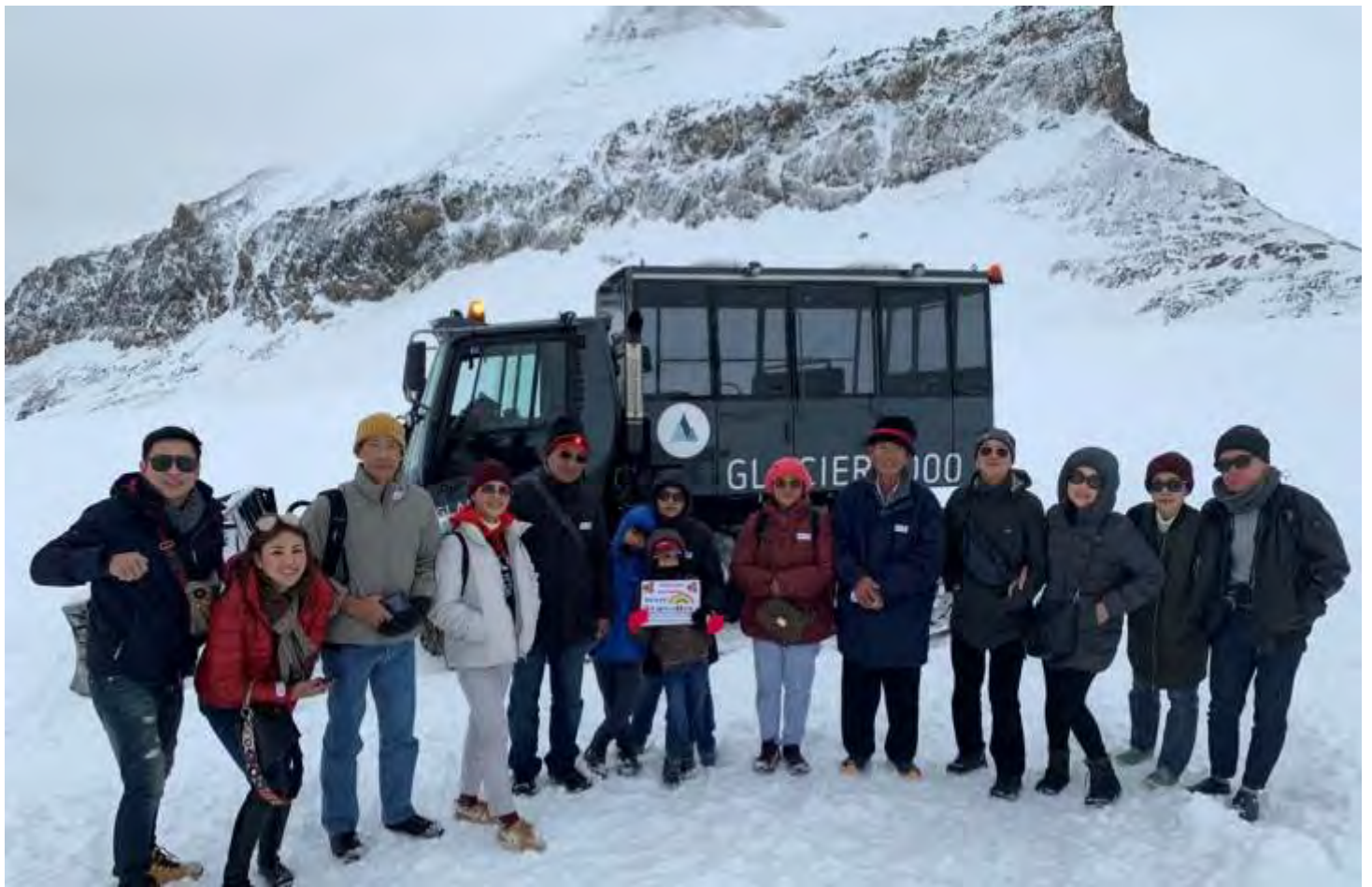
อิตาลี-สวิตเซอร์แลนด์-ฝรั่งเศส 9วัน TG SPECIAL3 วันที่ 16-24พ.ย.2562 (จำนวน26ท่าน)