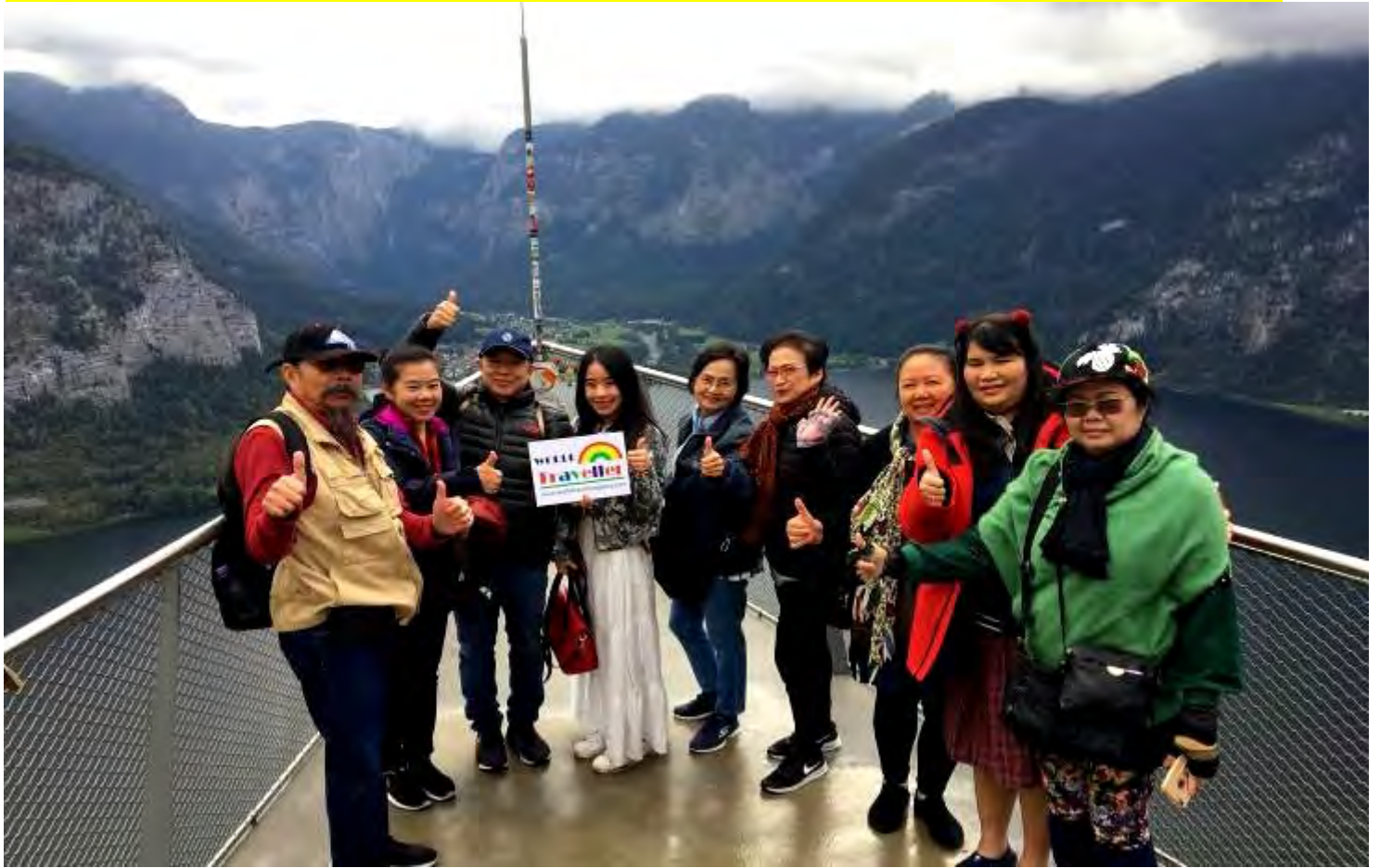
ยุโรปตะวันออก 9 วัน TG SUPERIOR พักริมทะเลสาบ เดินทาง22-30กันยายน2561 (จำนวน26ท่าน) แพคเกจพิเศษVIP...บริษัท อนันตา ดีเวลลอปเม้นท์ จำกัด(มหาชน)