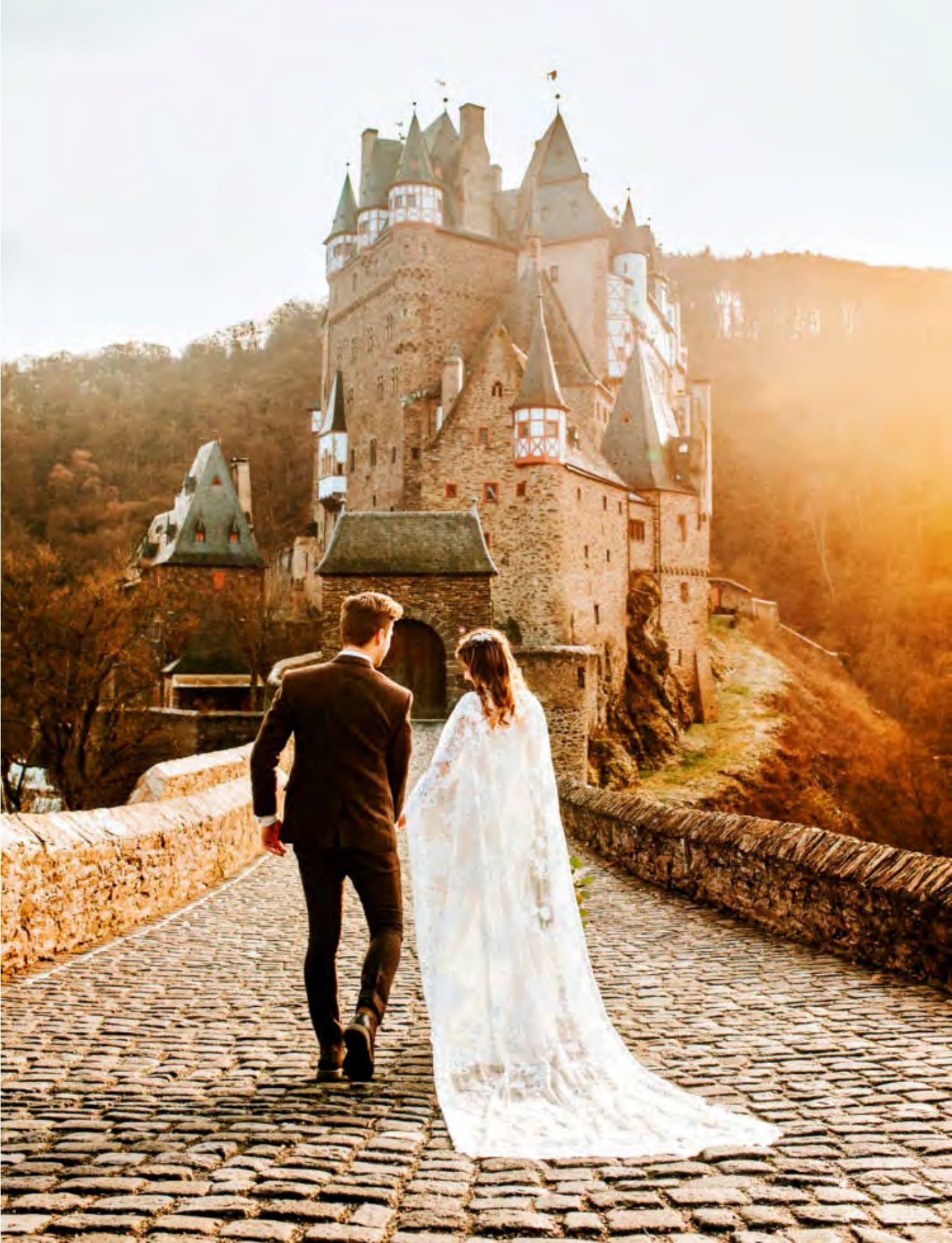
นำท่านเข้าชมภายในปราสาทถ่ายภาพแสนสวยคู่กับ ปราสาทเอลท์ซ์ Eltz castle