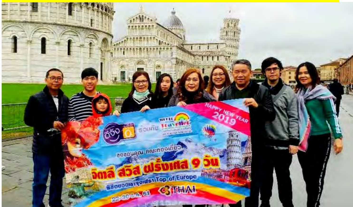
อิตาลี-สวิสเซอร์แลนด์-ฝรั่งเศส 9วัน TG PROMOTION4 เดินทาง 15-23 ธ.ค.2561(จำนวน32ท่าน)