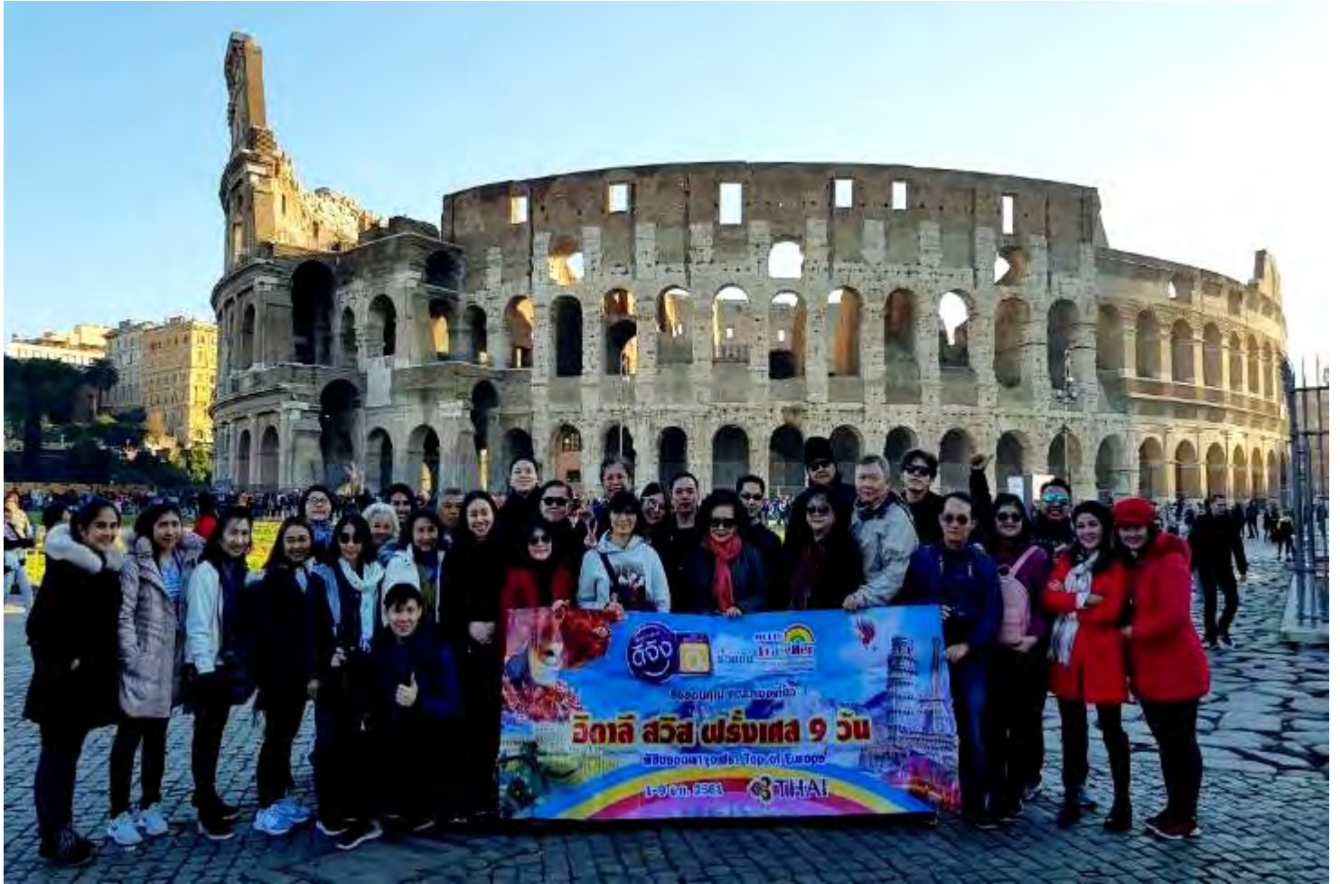
อิตาลี-สวิตเซอร์แลนด์-ฝรั่งเศส 9วัน TG PROMOTION4 เดินทางวันที่ 24พ.ย.-02ค.ค.2561(จำนวน15ท่าน)