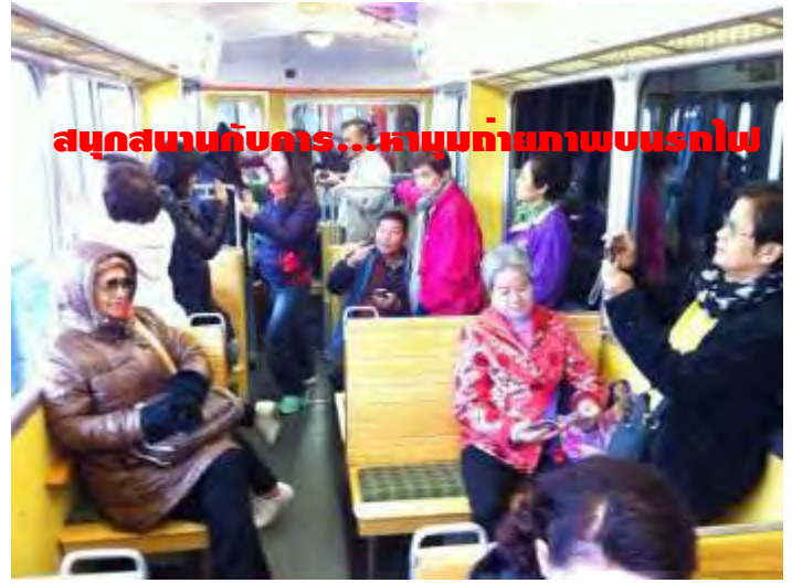
อยากสนุกสนาน และประทับใจกันแบบนี้... มาเที่ยวกับเรา: ครีบริบรองไม่ผิดหวัง