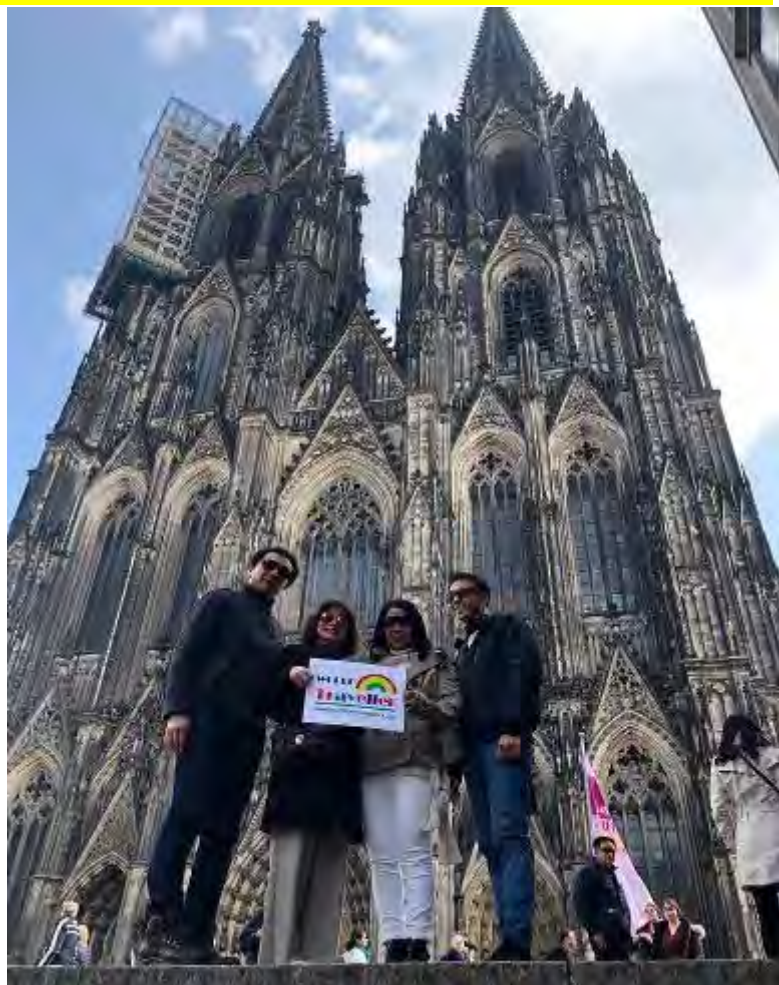
ยุโรปตะวันออก 9วัน TG DELUXE พักริมทะเลสาบ สงกรานต์ 12-20 เม.ย.2562 (จำนวน20ท่าน)