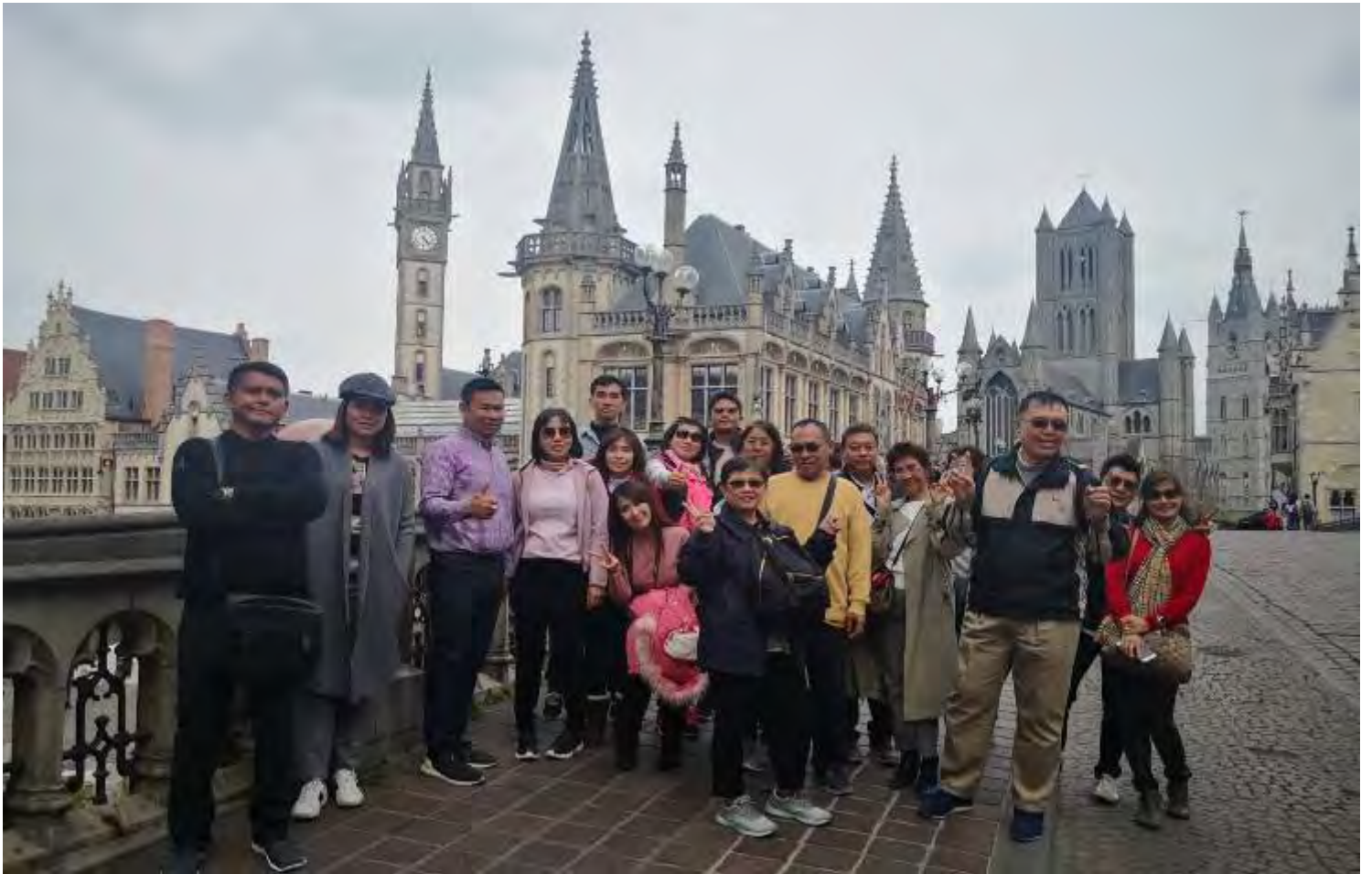
ยุโรปคอนฮอฟ(งานดอกไม้โลก)เยอรมัน เบนเธอร์แลนด์ เบลเยียม สงกรานต์10-17เม.ย.2562 (จำนวน33ท่าน)