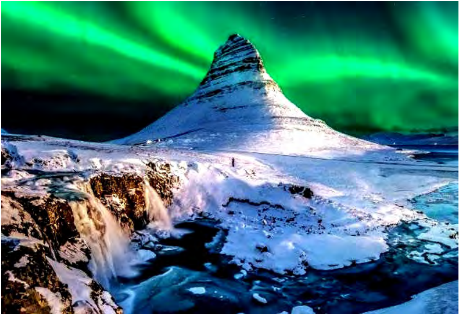
เป็นหนึ่งในสถานที่ที่ถูกถ่ายรูปมากที่สุดของไอซ์แลนด์

เดียว เป็นหนึ่งในสถานที่ที่ถูกถ่ายรูปมากที่สุดของไอซ์แลนด์ พร้อมขนน้ำตก Kirkjufellsfoss นักท่องเที่ยว ส่วนใหญ่จะถ่ายภาพสวยๆ ของน้ำตกที่มีฉากหลังเป็นภูเขา คีร์คจูเฟล เป็นสถานที่ที่มีความงดงามตลอดทั้งปีไม่ว่าจะ เดินทางมาเที่ยวในช่วงใด โดยเฉพาะในฤดูหนาวที่จะมองเห็น ภูเขาหมวกแม่แมด ปกคลุมไปด้วยหิมะเป็นสีขาวโพลน