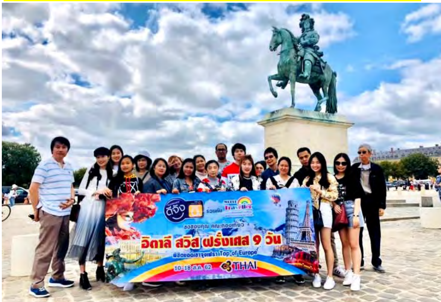
อิตาลี-สวิตเซอร์แลนด์-ฝรั่งเศส 9วัน TG PROMOTION4 วันที่ 13-21ก.ค.2562 (จำนวน26ท่าน)