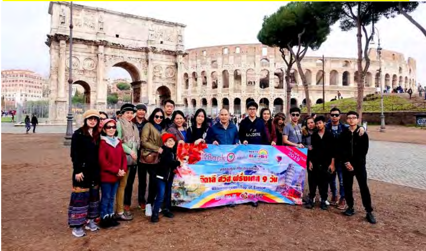
อิตาลี-สวิตเซอร์แลนด์-ฝรั่งเศส 10วัน TG DELUXE เดินทางปีใหม่ 22-31ธ.ค.2561(จำนวน20ท่าน)