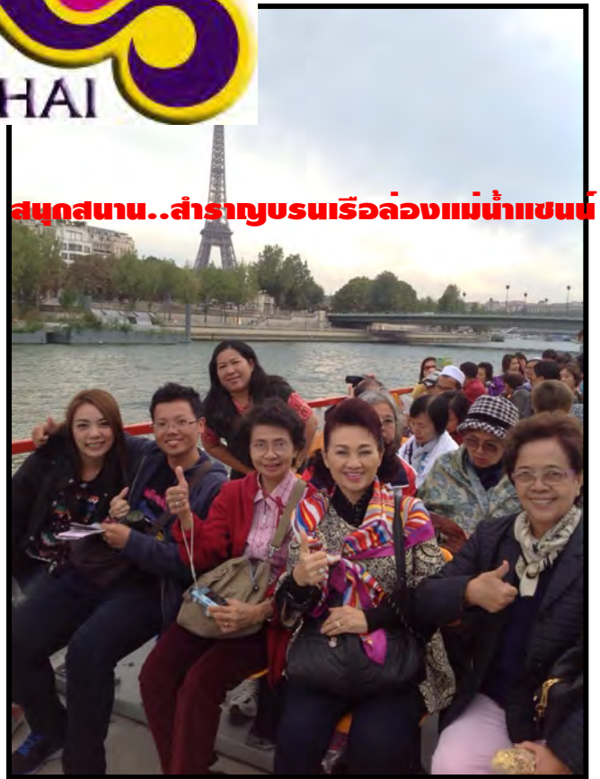
สนุกสนาน..สำราญชมเรือล่องแม่น้ำแซน

เรากำลังรอรับเกียรติจากทางท่าน...มาใช้บริการทัวร์ที่ดีจากทางเรา