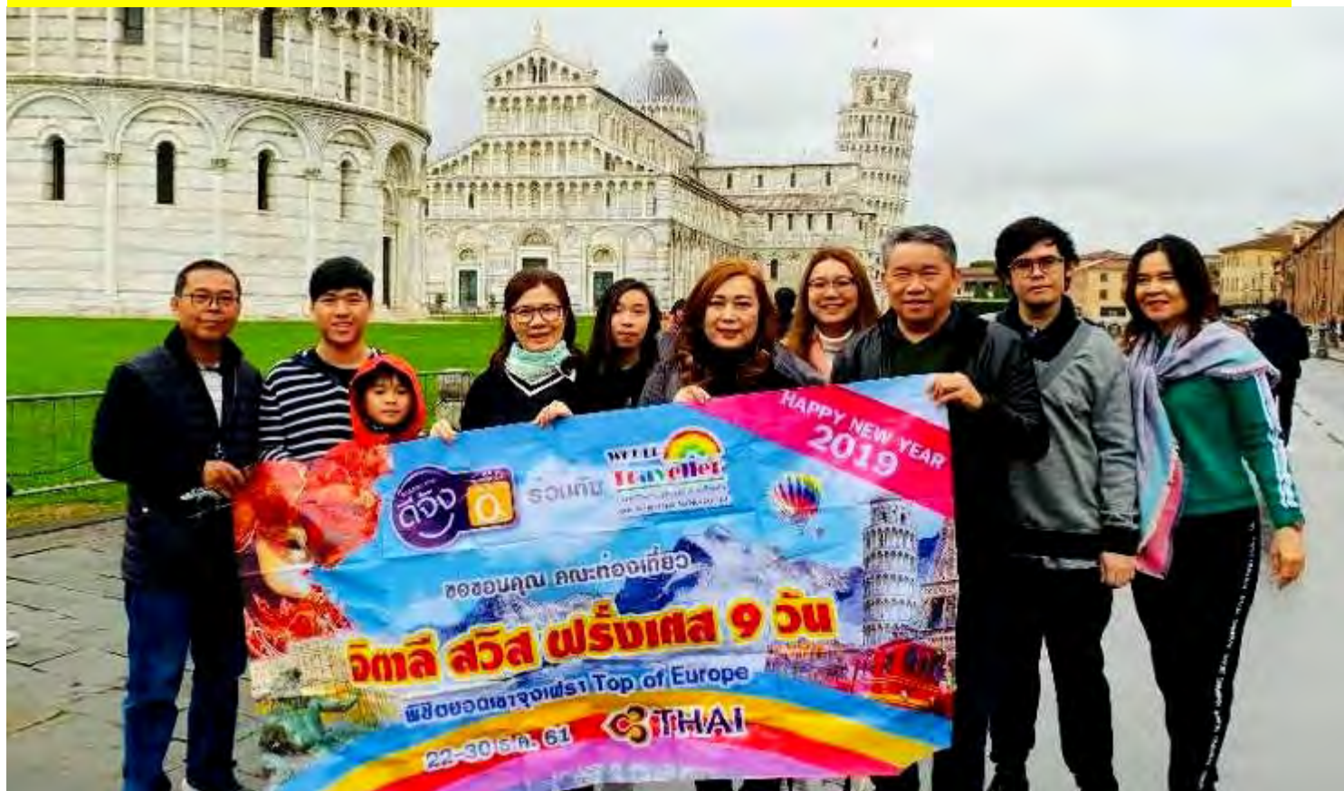
อิตาลี-สวิตเซอร์แลนด์-ฝรั่งเศส 9วัน TG PROMOTION4 เดินทาง 15-23 ธ.ค.2561(จำนวน32ท่าน)