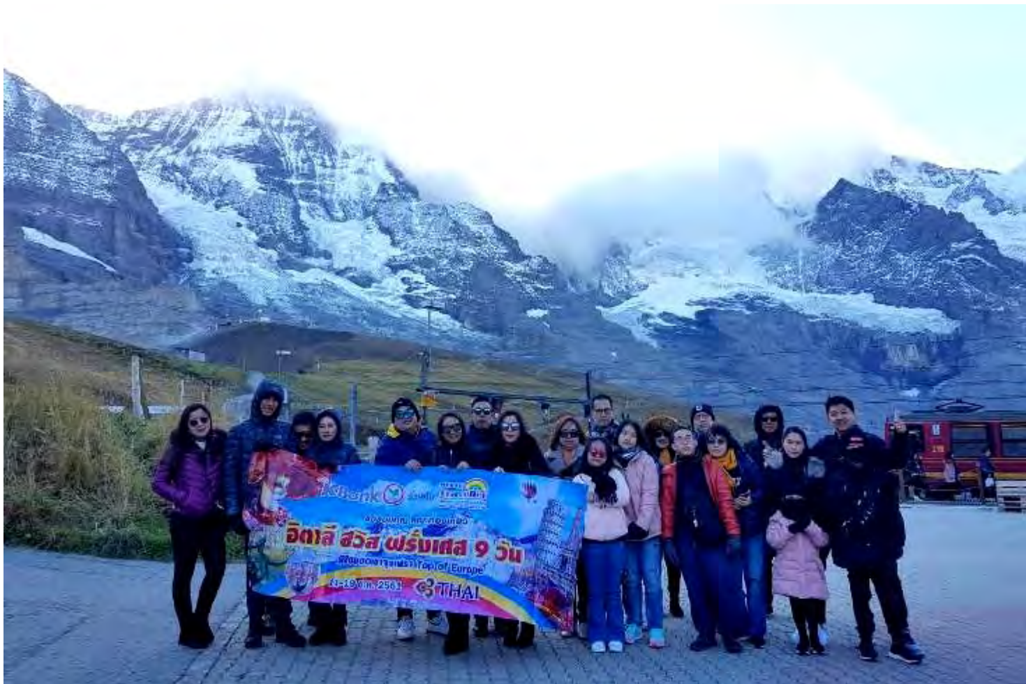
อิตาลี-สวิสเซอร์แลนด์-ฝรั่งเศส 9วัน TG PROMOTION4 เดินทางวันที่ 06-14 ต.ค.2561(จำนวน20ท่าน)