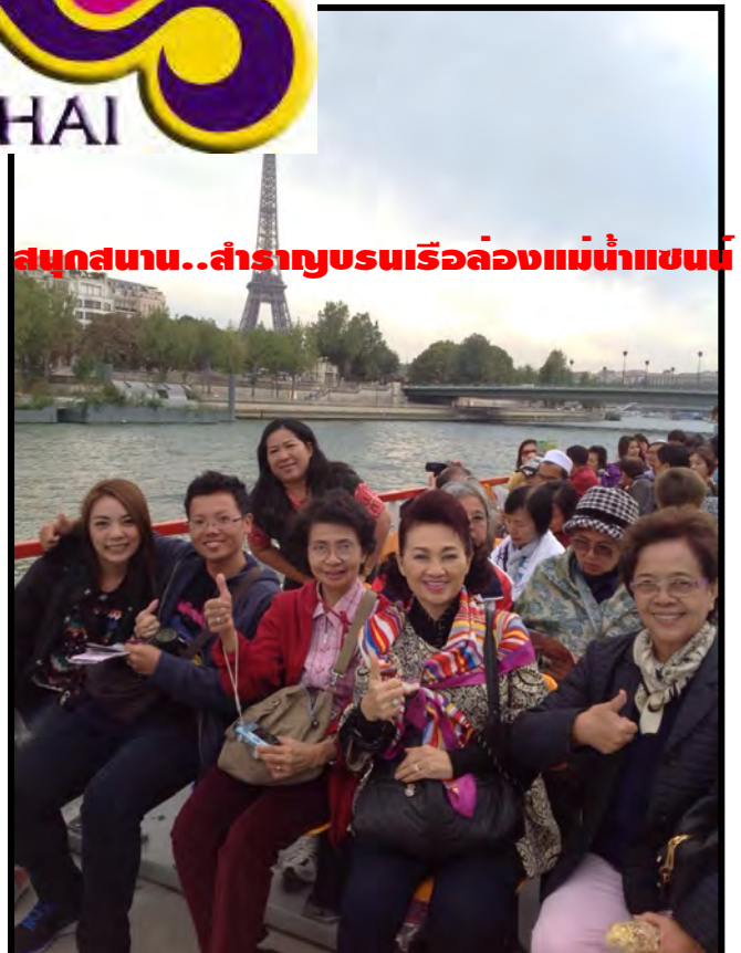
สนุกสนาน..สำราญชมเรือล่องแม่น้ำแซน

เรากำลังรอรับเกียรติจากทางท่าน...มาใช้บริการทัวร์ที่ดีจากทางเรา