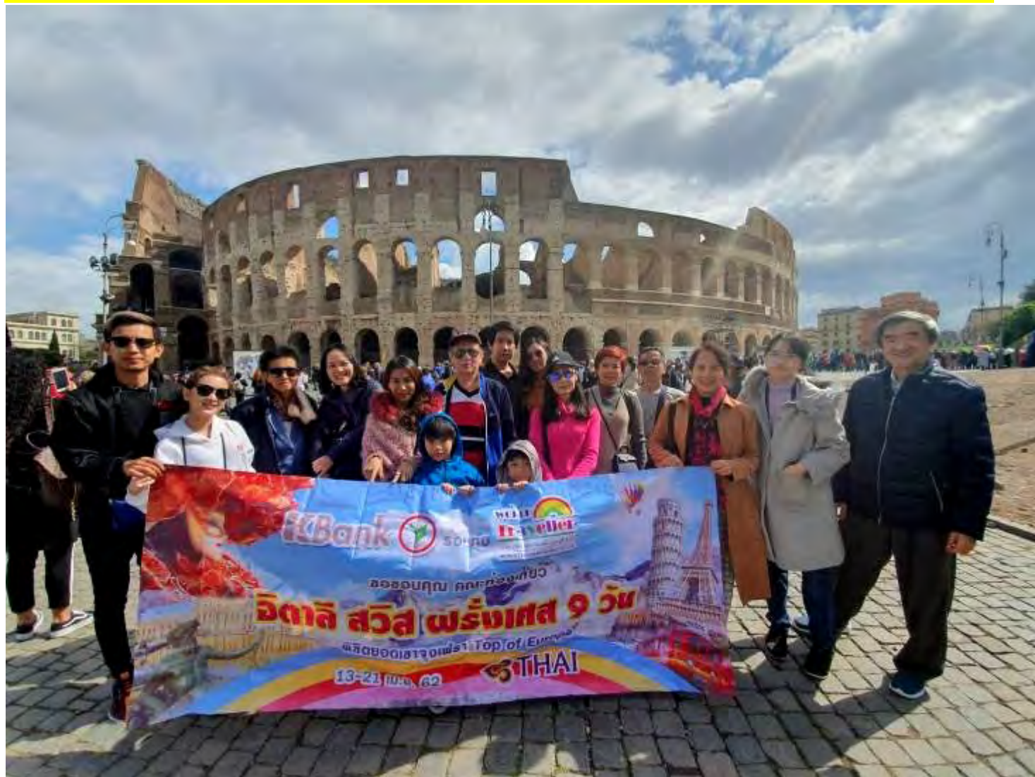
ยุโรปตะวันออก 9วัน TG SUPERIOR พัชรินทร์เลสมน สงกรานต์ 13-21เม.ย.2562 (จำนวน16ท่าน)