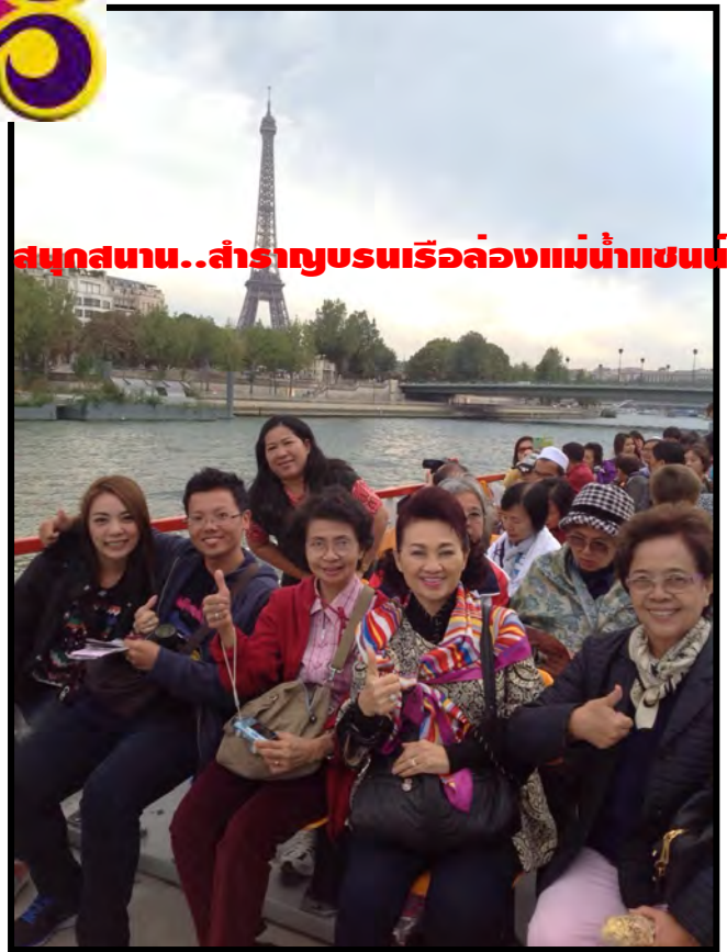
สนุกสนาน..สำราญชมเรือล่องแม่น้ำแซน

เรากำลังรอรับเกียรติจากทางท่าน...มาใช้บริการทัวร์ที่ดีจากทางเรา