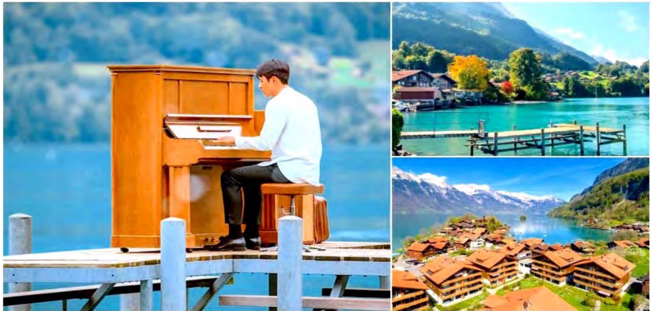
เกาหลีนั่นเอง

นำคณะออกเดินทางสู่หมู่บ้าน ISELTWALD UNSEEN ตามรอยซีรีส์ดังภาพยนตร์เกาหลี ผู้กอง Crash Landing on You มา Landing ซึ่งเมืองเล็กๆแห่งนี้ ชื่อว่า Iseltwald เป็นหนึ่งในสถานที่ถ่ายทำซีรีส์ยอดนิยมจาก