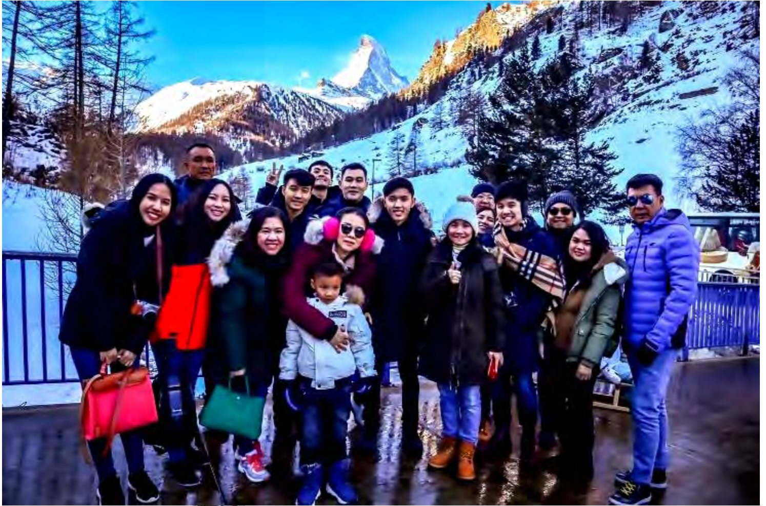
ยุโรปตะวันออก 9วัน TG DELUXE พัก Hallstatt เดินทางปีใหม่ 29ธ.ค.-06ม.ค.2562(จำนวน28ท่าน)