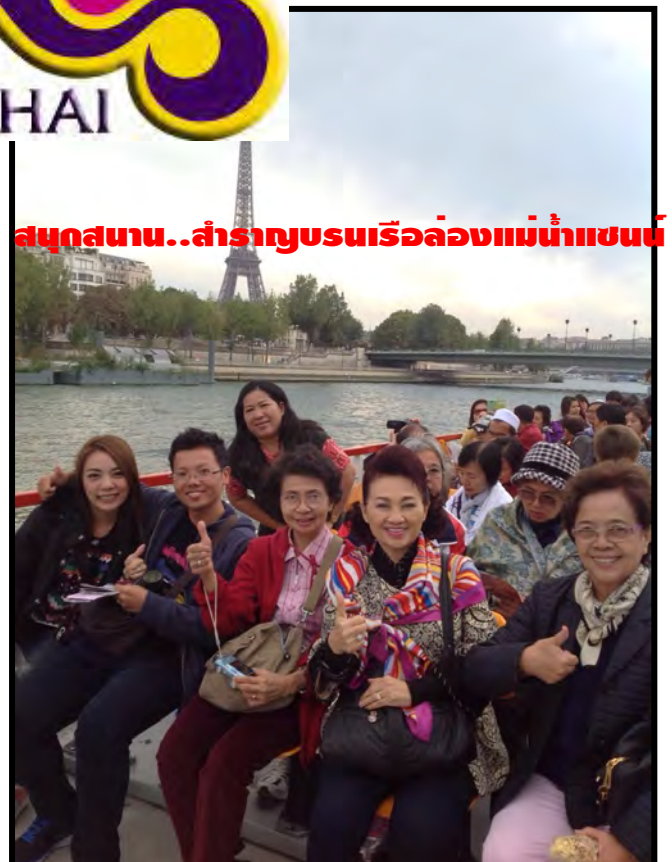
สนุกสนาน..สำราญชมเรือล่องแม่น้ำแซน

เรากำลังรอรับเกียรติจากทางท่าน...มาใช้บริการทัวร์ที่ดีจากทางเรา