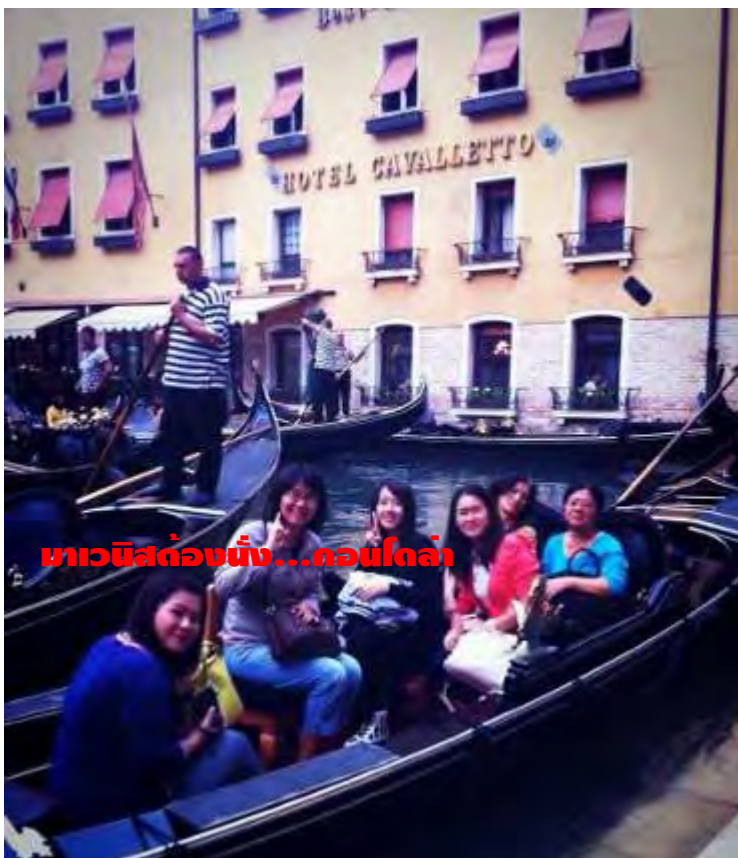
มาวณีสต่องนี้...คอนโดล่า