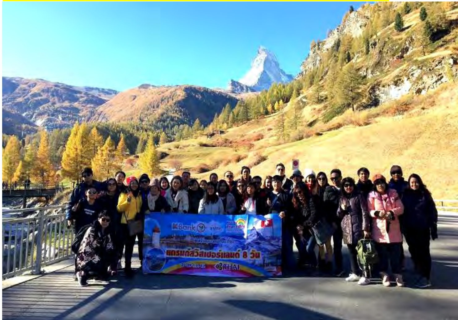
อิตาลี-สวิสเซอร์แลนด์-ฝรั่งเศส 9 วัน TG PROMOTION 4 ช่วงหยุดปี: 20-28 ต.ค. 2561 (จำนวน 40 ท่าน)