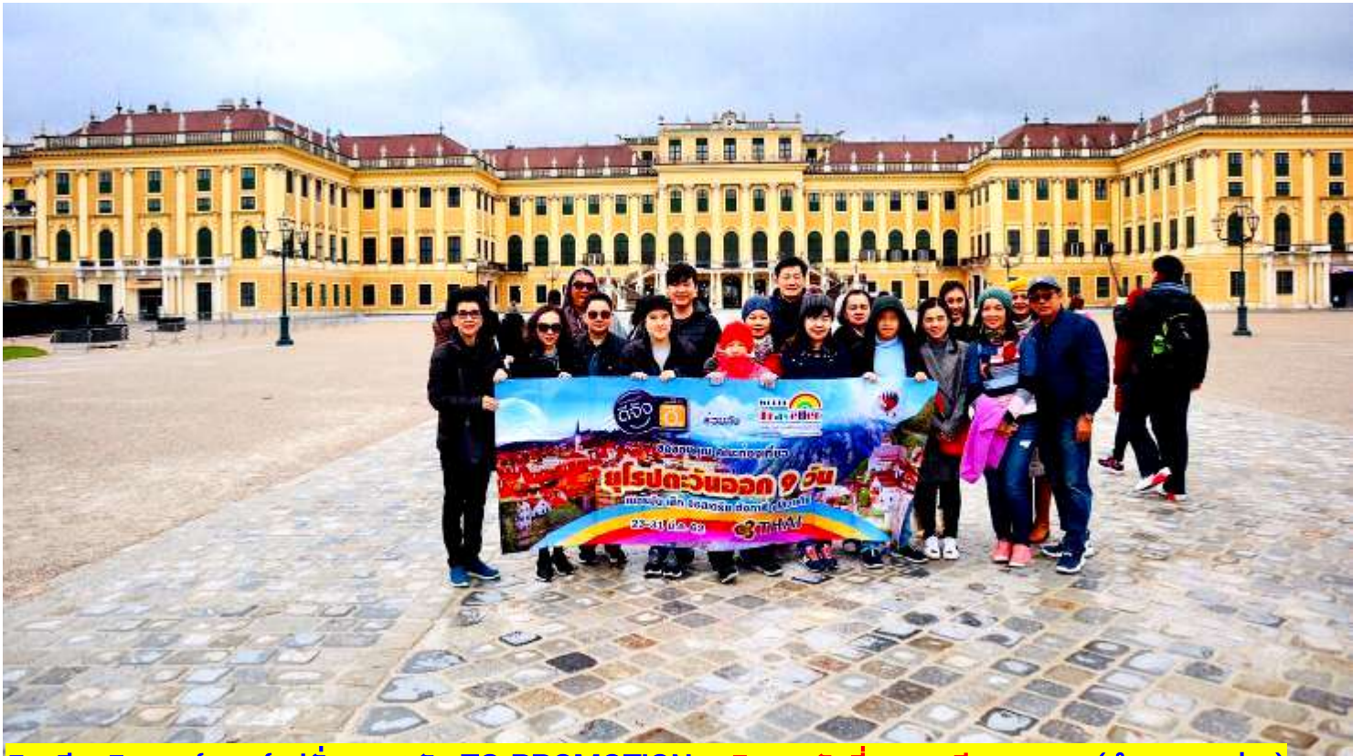
อิตาลี-สวิสเซอร์แลนด์-ฝรั่งเศส 9 วัน TG PROMOTION4 เดินทางวันที่ 2-10 มี.ค. 2562 (จำนวน 20 ท่าน)