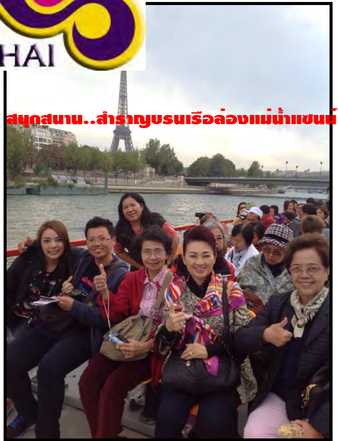
สนุกสนาน..สำราญชมเรือล่องแม่น้ำแซน

เรากำลังรอรับเกียรติจากทางท่าน...มาใช้บริการทัวร์ที่ดีจากทางเรา