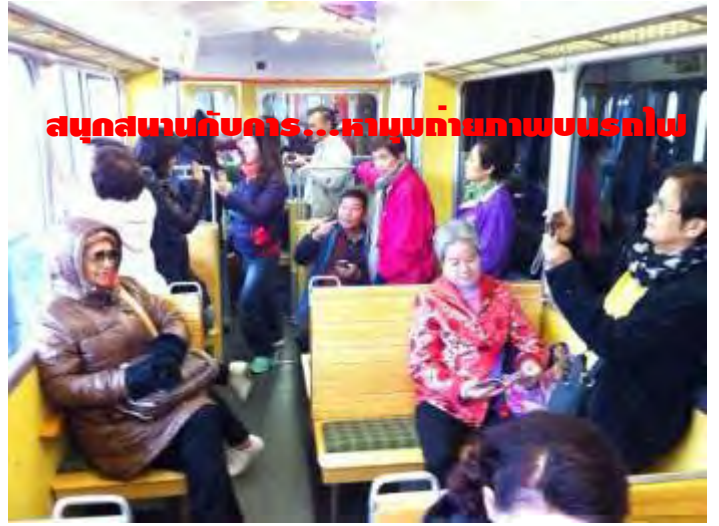
สนุกสนานกับการ...หามุมถ่ายภาพบนรถไป

อยากสนุกสนาน และประทับใจกันแบบนี้... มาเที่ยวกับเรา: ครีบริบรองไม่ผิดหวัง