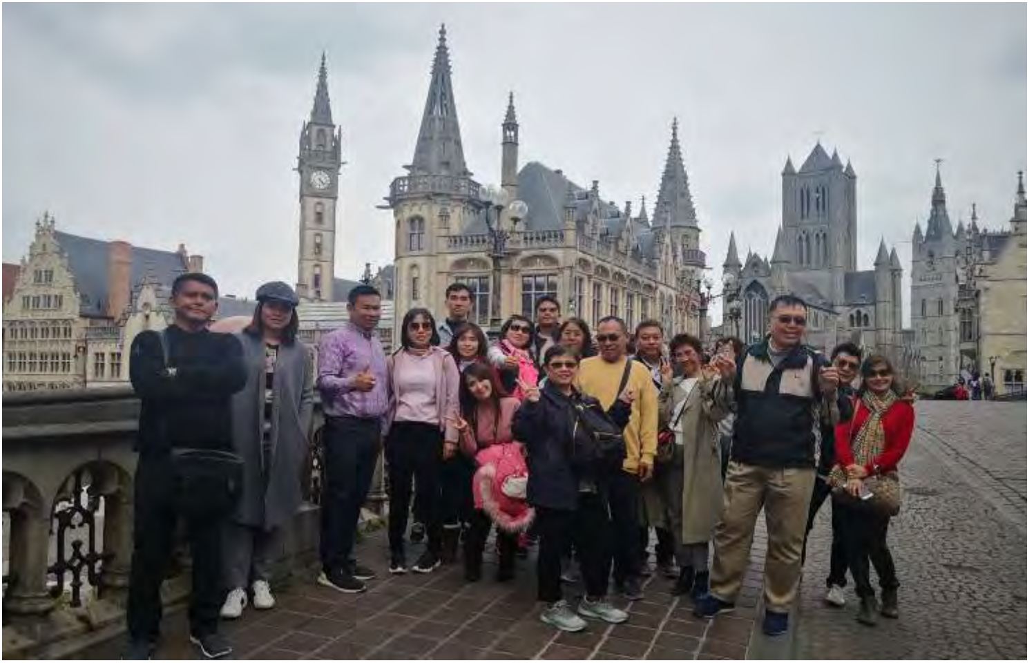
ยุโรปคอนฮอฟ(งานดอกไม้โลก)เยอรมัน เบนเธอร์แลนด์ เบลเยียม สงกรานต์10-17เม.ย.2562 (จำนวน33ท่าน)