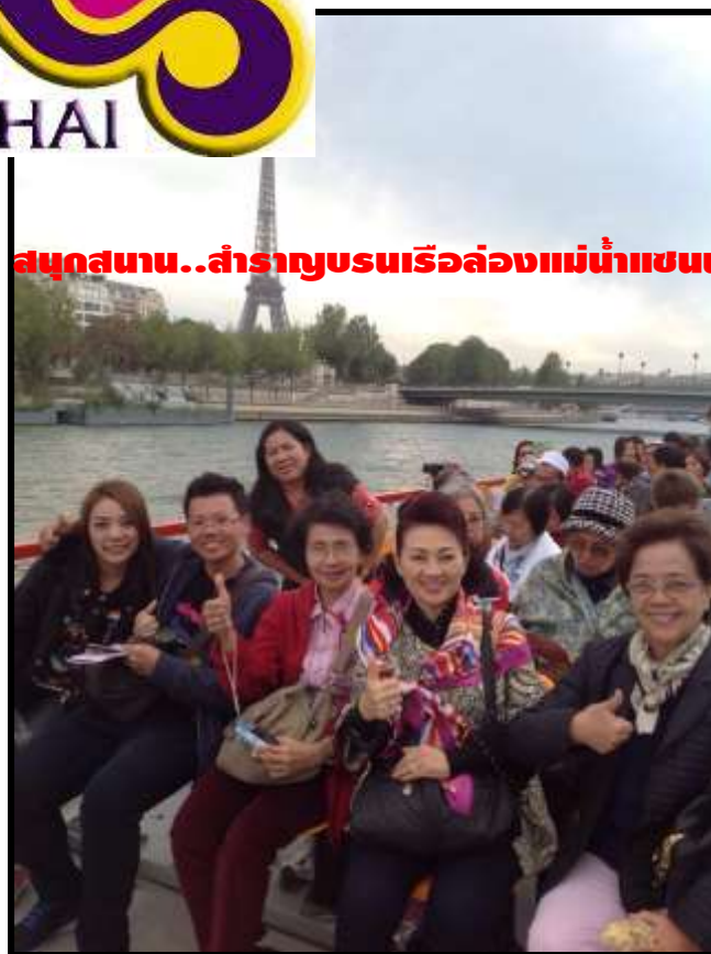
สนุกสนาน..สำราญชมเรือล่องแม่น้ำแซน

เรากำลังรอรับเกียรติจากทางท่าน...มาใช้บริการทัวร์ที่ดีจากทางเรา