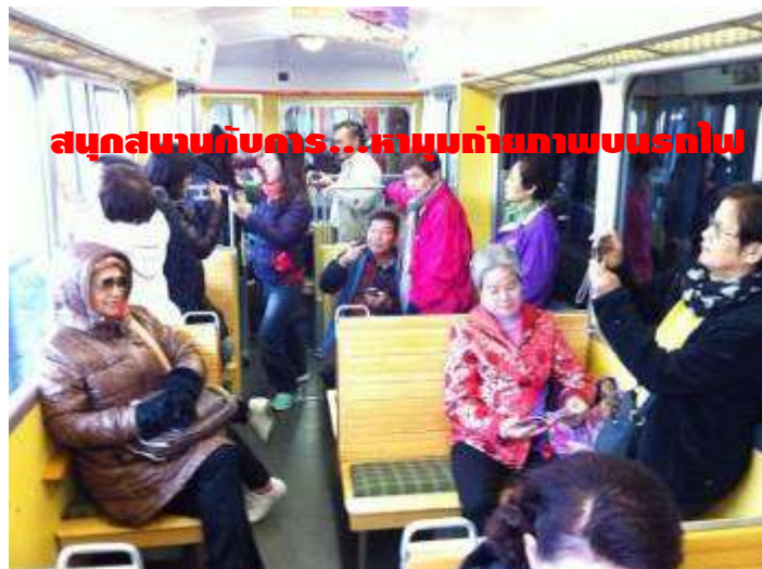
สนุกสนานกับคาร...หาหุ่นถ่ายภาพบนรถไฟ

อยากสนุกสนาน และประทับใจกันแบบนี้... มาเที่ยวกับเรา: ครีบรับรองไม่ผิดหวัง