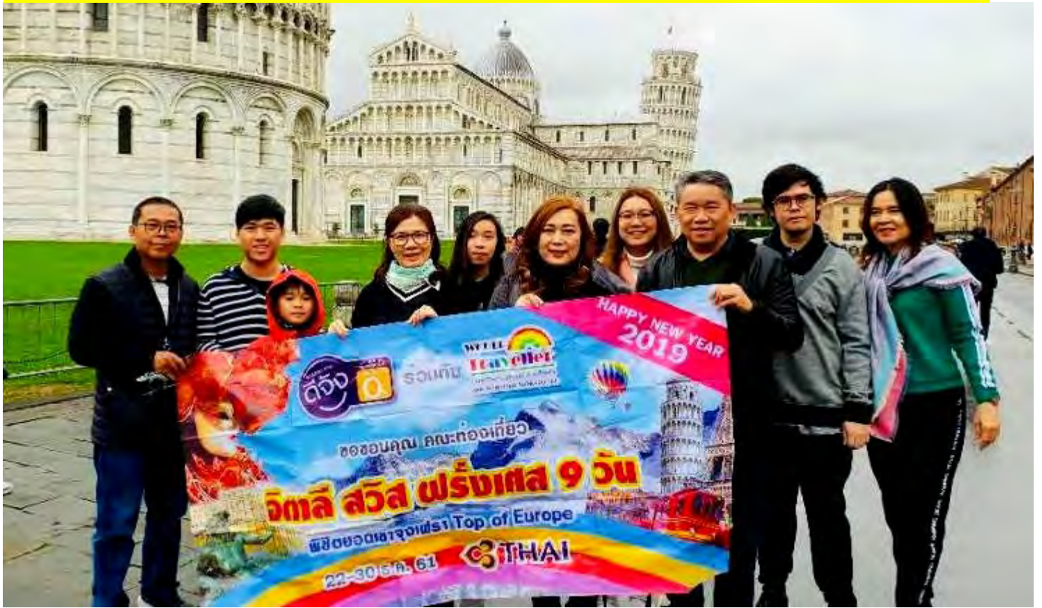
อิตาลี-สวิตเซอร์แลนด์-ฝรั่งเศส 9วัน TG PROMOTION4 เดินทาง 15-23 ธ.ค.2561(จำนวน32ท่าน)