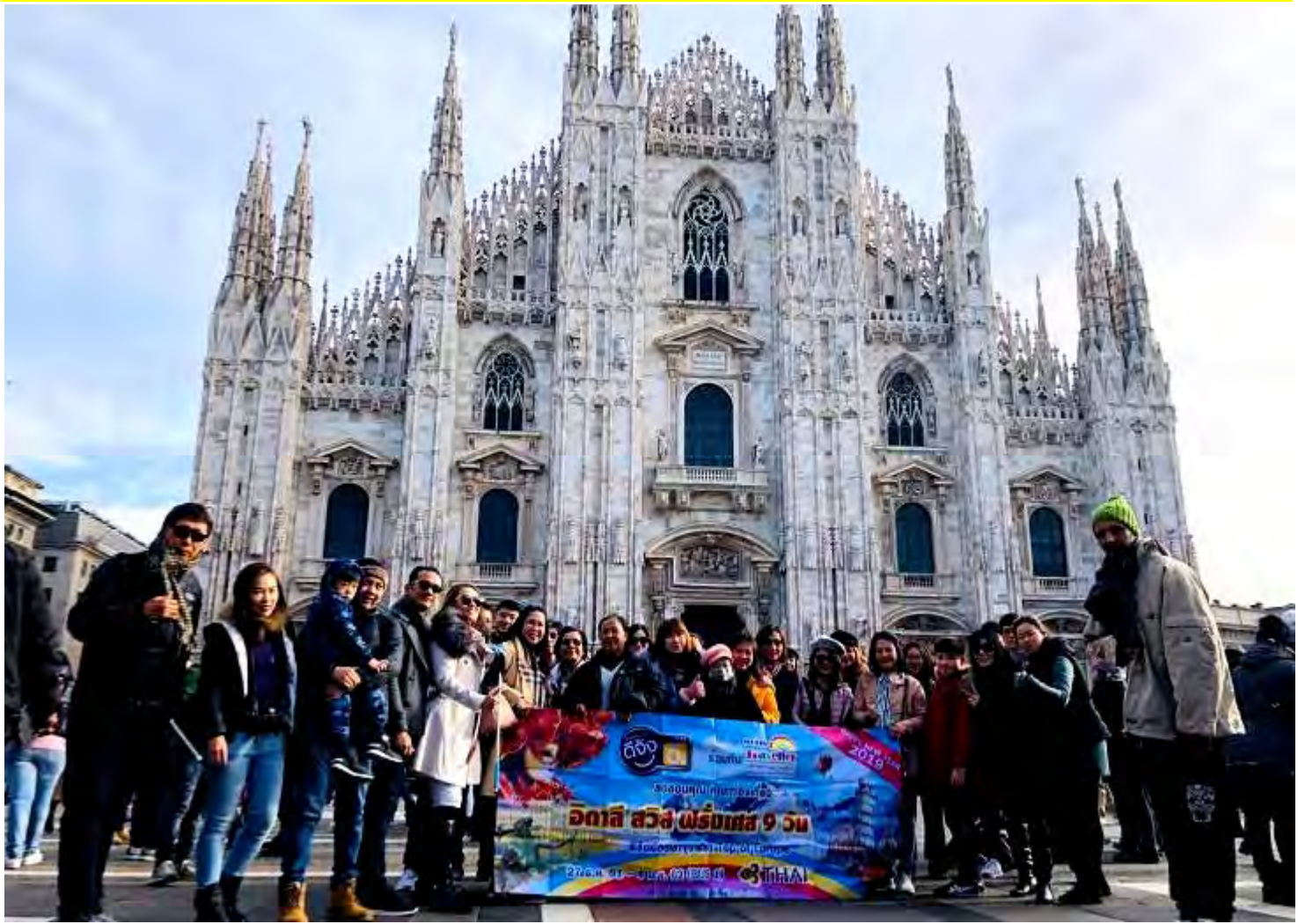
อิตาลี-สวิสเซอร์แลนด์-ฝรั่งเศส 9วัน TG PROMOTION4 เดินทางปีใหม่ 25ธ.ค.-02ม.ค.2562(จำนวน32ท่าน)