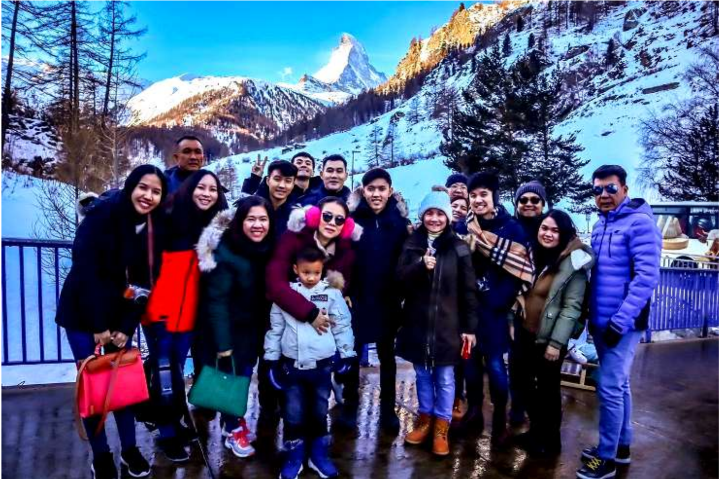
ยุโรปตะวันออก 9วัน TG DELUXE พัก Hallstatt เดินทางปีนํ 29ค.ค.-06ม.ค.2562(จํนวน28ทํน)