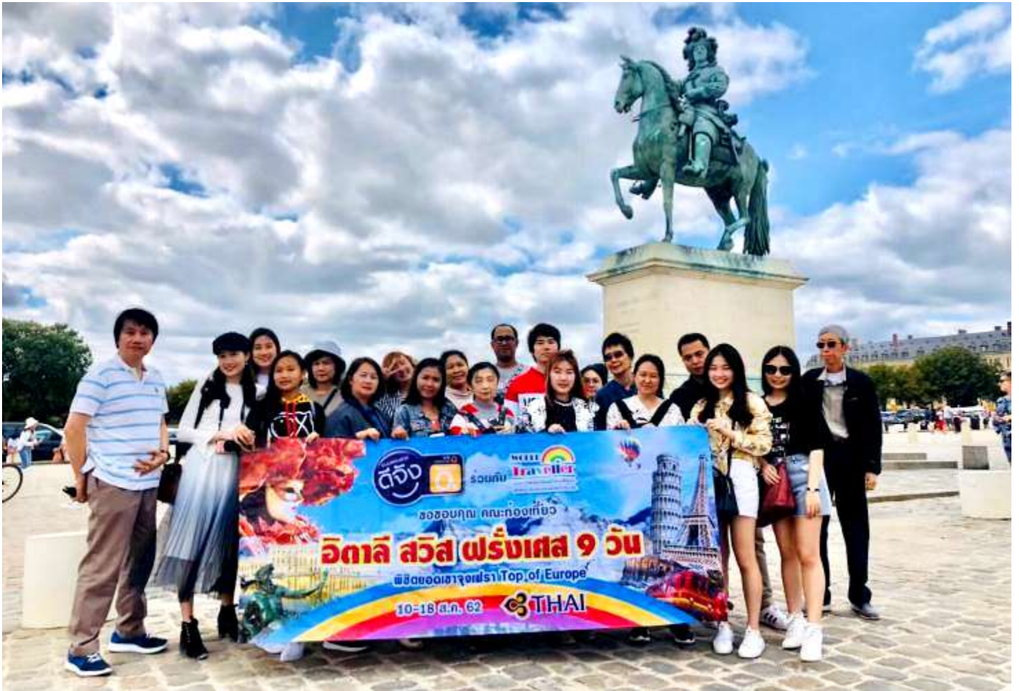
อิตาลี-สวิตเซอร์แลนด์-ฝรั่งเศส 9วัน TG PROMOTION4 วันที่ 13-21ก.ค.2562 (จำนวน26ท่าน)