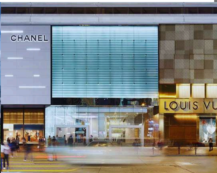
ห้าง Harbour City แหล่งรวมทุกอย่าง...ย่านจิมซาจุ่ย